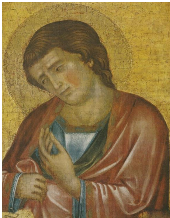
Slika 12. Radionica Paola Veneziana, Sv. Ivan iz kompozicije Raspeća, Muzej za umjetnost i obrt u Zagrebu, oko 1350. godine