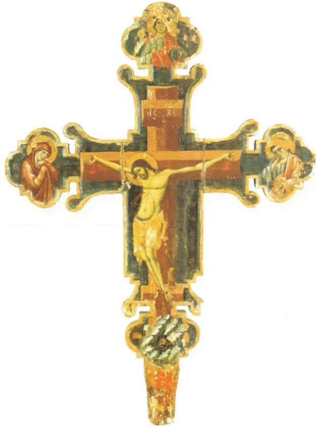
Slika 11. Nepoznati majstor, Slikano raspelo, župna crkva Gospe od Ružarija u Segetu kraj Trogira, prva polovina 14. stoljeća