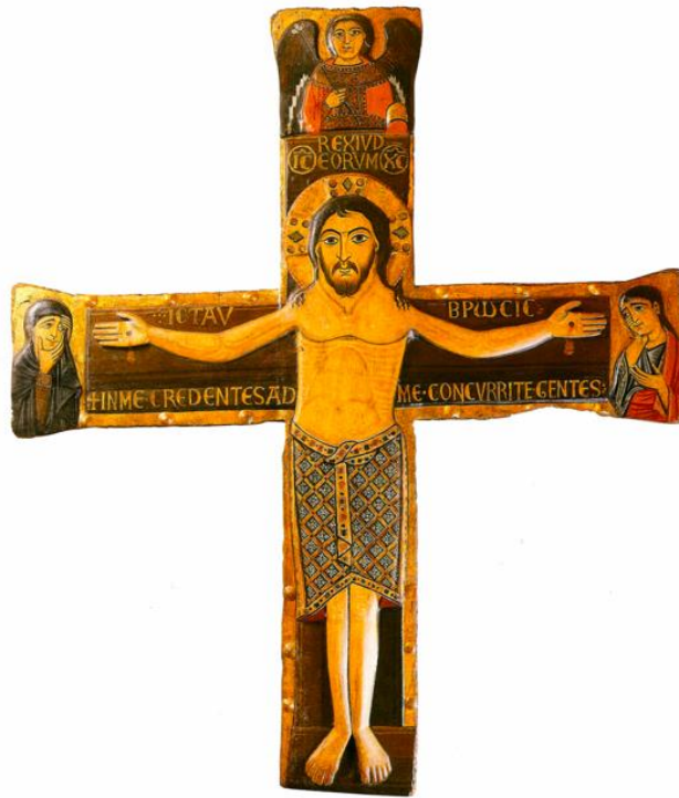
Slika 1. Nepoznati majstor, Reljefno slikano raspelo, Riznica samostana Sv. Frane u Zadru, 12./13. stoljeće (izvor: E. HILJE – R. TOMIĆ, 2006., 92.)