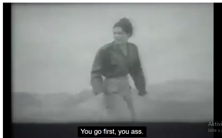
Imagen n°4. La discusión entre el Mexicano y Manuela (Manuela, 24:13)