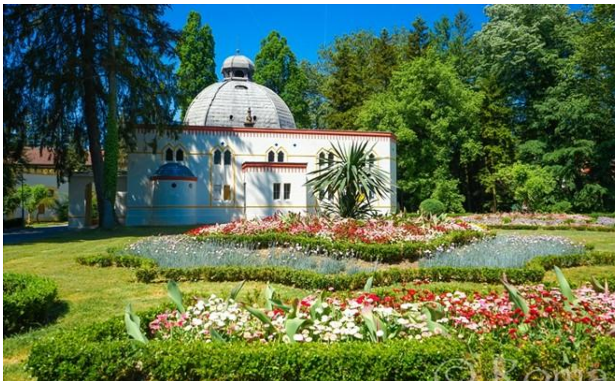
Slika 3: Centralno blatno kupalište

http://www.visitdaruvar.hr/ljecilisni-perivoj-julijev-park.aspx