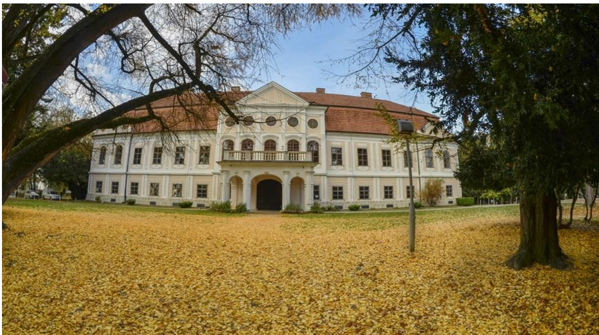
Slika 4: Dvorac grofa Antuna Jankovića

http://hotspots.net.hr/2016/02/upoznajmo-daruvar-grad-koji-voli-zivot/