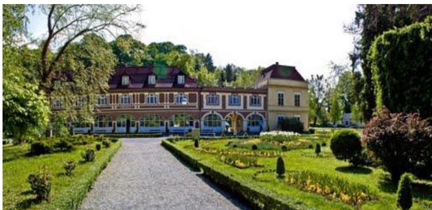
Slika 1: Arcadia

http://www.panoramio.com/user/217038/tags/Daruvar