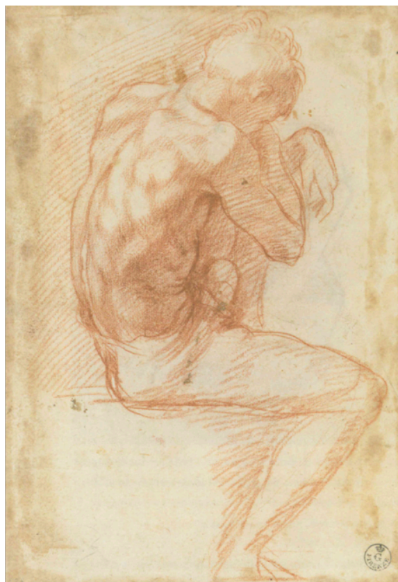
Slika 25. Andrea del Sarto, Studija sjedećeg akta u profilu s desne strane , c. 1527., crvena kreda na papiru, 27,1 x 18,6 cm, Gabinetto Disegni e Stampe, Gallerie degli Uffizi, Firenca