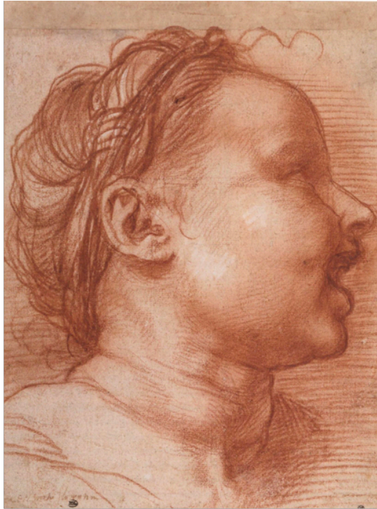
Slika 9. Andrea del Sarto, Glava djeteta , 1518., crvena i bijela kreda, 23,8 x 19 cm, Département des Arts Graphiques, Chalcographie du Louvre, Musée du Louvre, Pariz