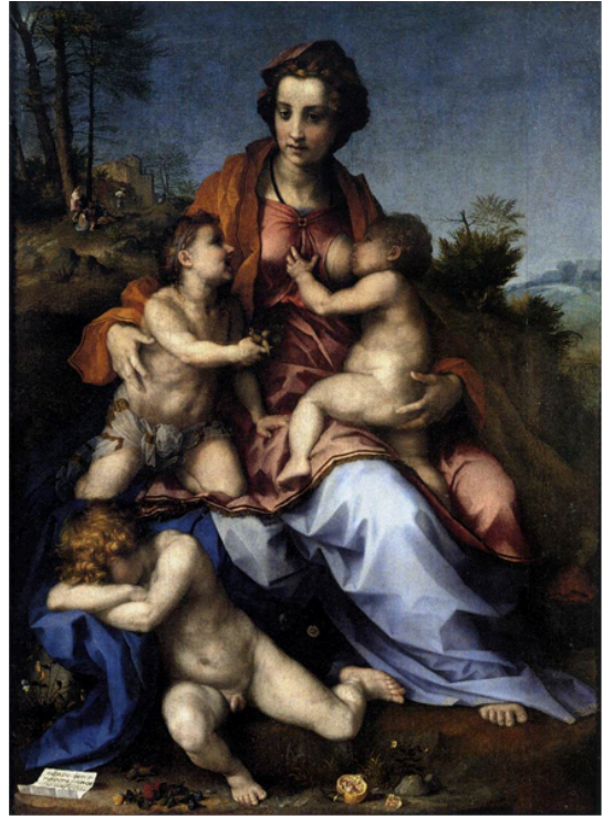
Slika 10. Andrea del Sarto, Milosrđe , 1518., ulje na platnu, 185 x 137 cm, Département des Peintures, Musée du Louvre, Pariz