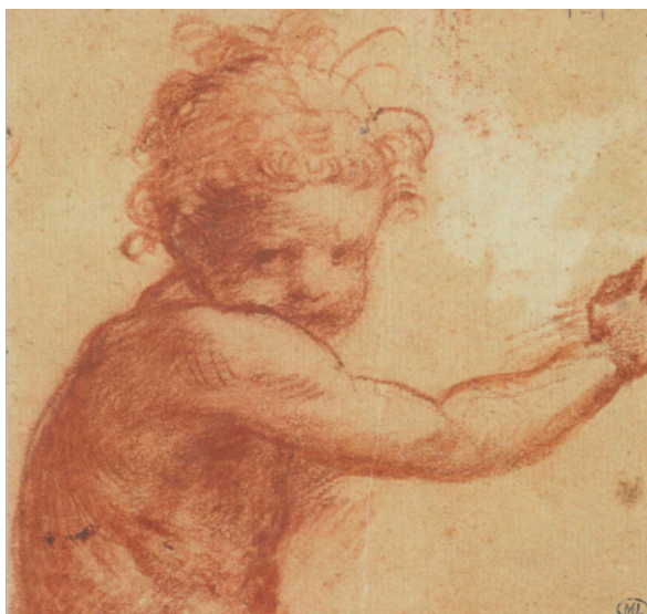
Slika 13. Andrea del Sarto, Studija djeteta , c. 1517., crvena kreda, na papiru, 10,6 x 11,1 cm, Département des Arts Graphiques, Musée du Louvre, Pariz