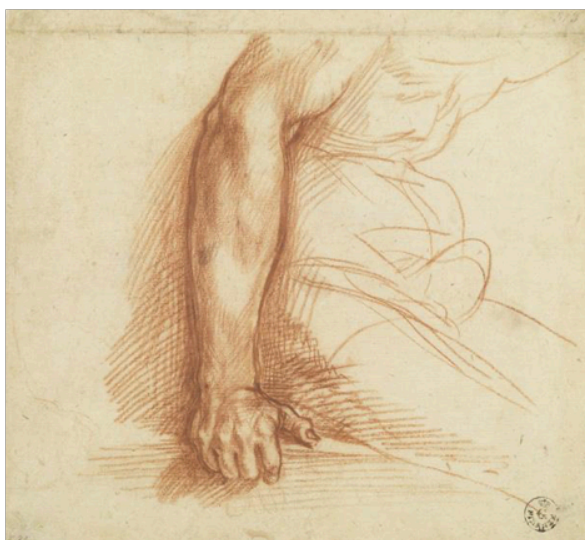
Slika 15. Andrea del Sarto, Studija ruke sjedeće figure prikazane u profilu s desne strane , c. 1526-27., crvena kreda na papiru, 19,2 x 20,9 cm, Gabinetto Disegni e Stampe, Gallerie degli Uffizi, Firenca