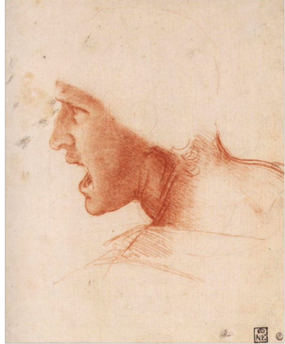
Slika 2. Leonardo da Vinci, Studija za glavu vojnika za "Bitku kod Anghiarija" , c. 1504., crvena kreda, na vrlo blijedom oker-rozo pripremljenom papiru, 22,7 x 18,6 cm, Szépművészeti Múzeum, Budimpešta