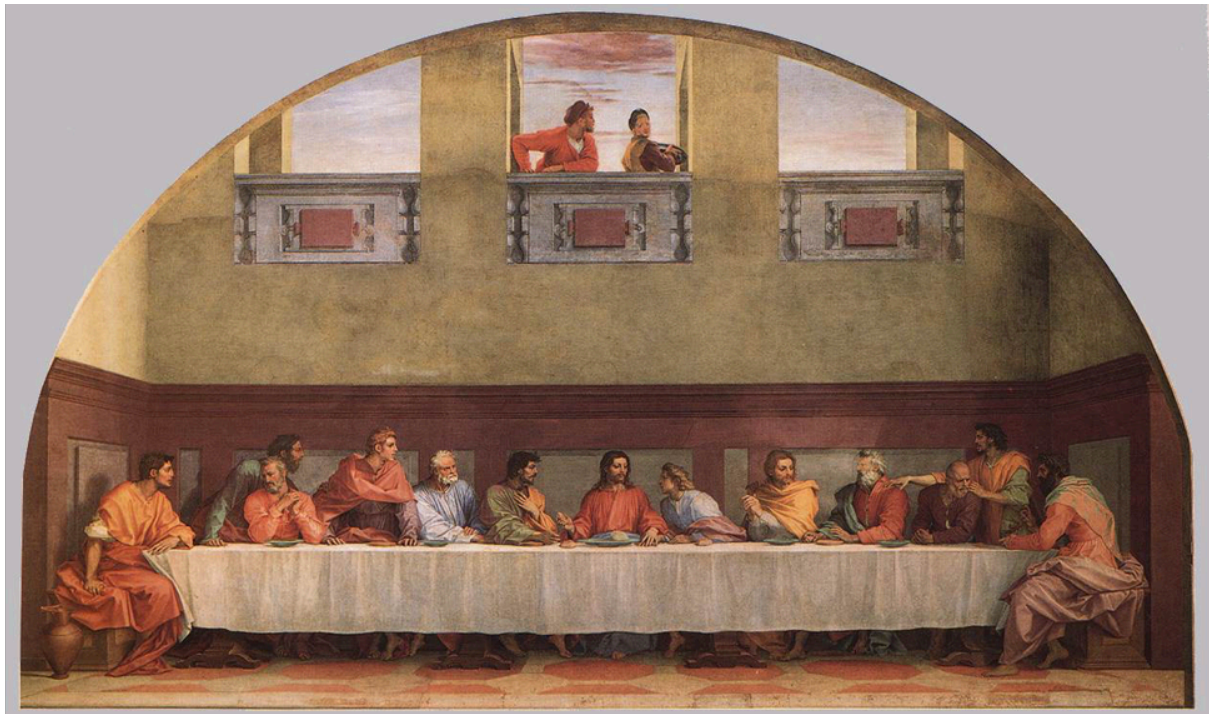
Slika 16. Andrea del Sarto, Posljednja večera , c. 1526-27., freska, 462 x 827 cm, Museo del Cenacolo di San Salvi, Firenca