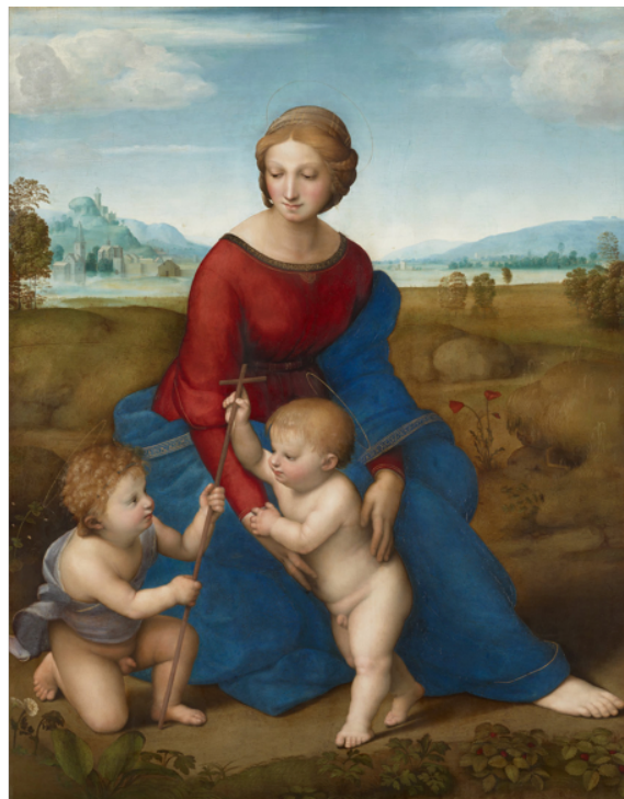
Slika 6. Rafael, Madonna del Prato , c. 1505-6., ulje na drvenom panelu, 88 x 113 cm, Kunsthistorisches Museum, Beč