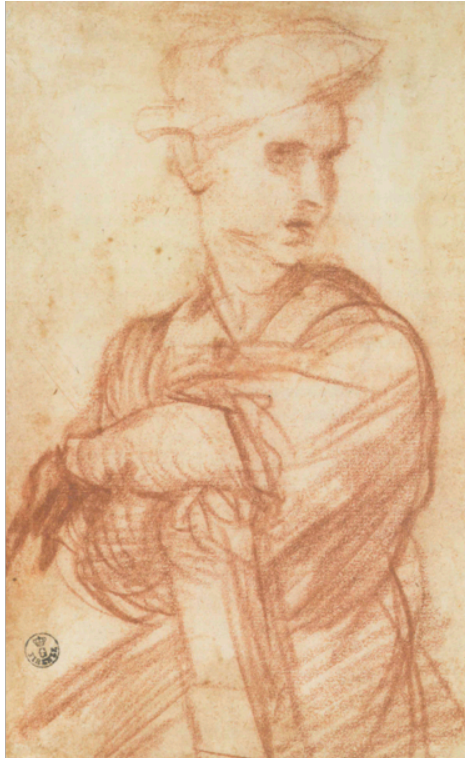
Slika 18. Andrea del Sarto, Studija mladića , c. 1517-18., crvena kreda, na papiru, 18,8 x 11,6 cm, Gabinetto Disegni e Stampe, Gallerie degli Uffizi, Firenca