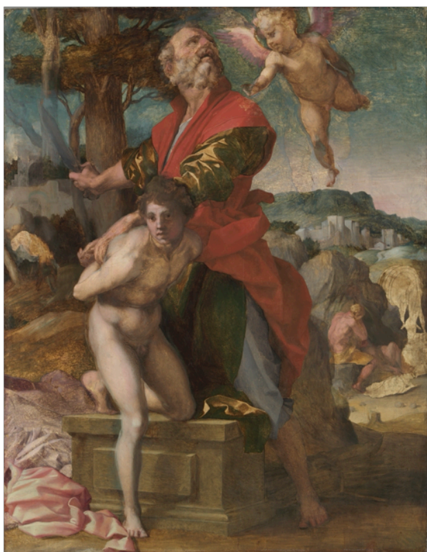
Slika 22. Andrea del Sarto, Žrtva Izaka , c. 1528., ulje na panelu, 178 x 138 cm, Cleveland Museum of Art, Cleveland