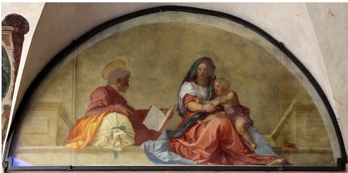
Slika 21. Andrea del Sarto, Madonna del sacco , 1525., freska, 191 x 403 cm, Santissima Annunziata, Firenca