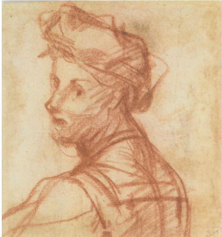
Slika 19. Andrea del Sarto, Studija mladića , c. 1517-18., crvena kreda, na papiru, 13 x 12,6 cm, Gabinetto Disegni e Stampe, Gallerie degli Uffizi, Firenca