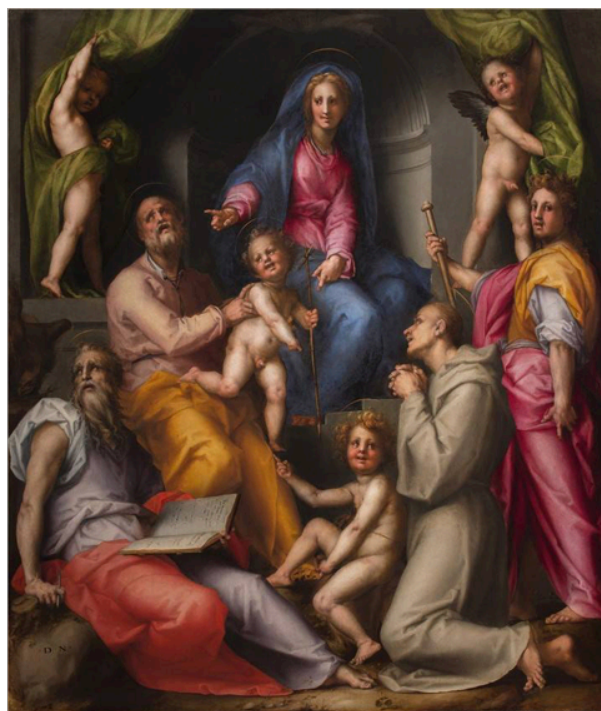
Slika 14. Jacopo Pontormo, Djevica s Djetetom i svecima (Pala Pucci) , 1518., ulje na drvenom panelu, 214 x 185 cm, San Michele Visdomini, Firenca