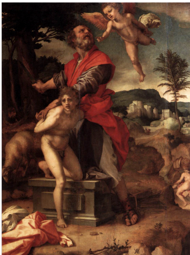
Slika 24. Andrea del Sarto, Žrtva Izaka , c. 1528., ulje na panelu, 213 x 159, Staatliche Kunstsammlungen, Gemäldegalerie Alte Meister, Dresden