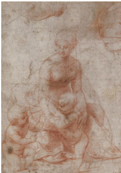
Slika 5. Rafael, Djevica i Dijete s djetetom svetim Ivanom Krstiteljem , c. 1506-7., crvena kreda, na papiru, 22,4 x 15,8 cm, Rogers Fund, The Metropolitan Museum of Art, New York