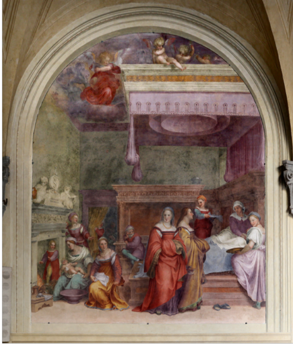
Slika 1. Andrea del Sarto, Rođenje Djevice (Natività della Vergine) , 1513-14., freska, 410 x 340 cm, Chiostro dei Volti, Santissima Annunziata, Firenca