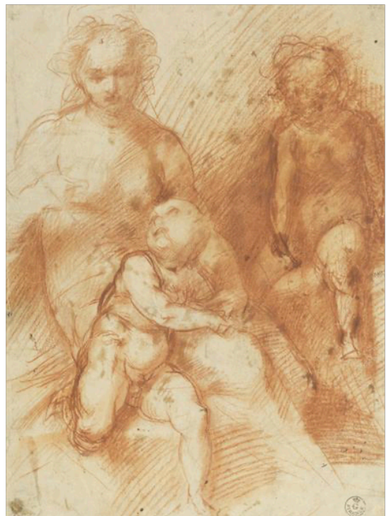
Slika 12. Andrea del Sarto, Djevice s Djetetom i svetim Ivanom , c. 1516-17., crvena kreda, na papiru, 31,5 x 23,3 cm, Gabinetto Disegni e Stampe, Gallerie degli Uffizi, Firenca