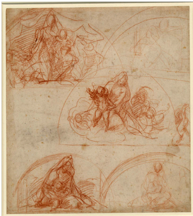
Slika 20. Andrea del Sarto, Pet studija za lunetu s Djevicom i Djetetom , c. 1525., crvena kreda, na papiru, 28,9 x 26,1 cm, The British Museum, London