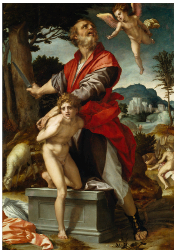
Slika 23. Andrea del Sarto, Žrtva Izaka , c. 1528., ulje na panelu, 98 x 69 cm, Museo del Prado, Madrid