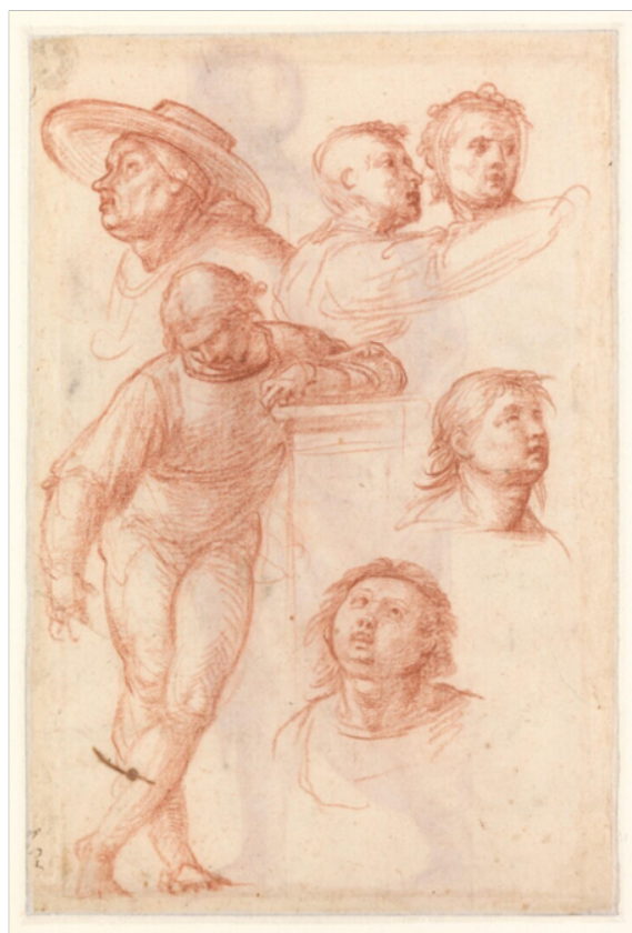
Slika 8. Fra Bartolomeo, Mladić naslonjen na postolje i pet studija glava za oltar Gospe od Milosrda , c. 1514-15., crvena kreda na papiru, 28,7 x 19,7 cm, Museum Boijmans Van Beuningen, Rotterdam