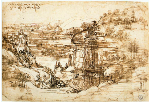
Slika 3. Leonardo da Vinci, Pejzaž rijeke Arno (Paesaggio con fiume) , 1473., pero i tuš, s tragovima crvene krede, na papiru, 19 x 28,5 cm, Gabinetto Disegni e Stampe, Gallerie degli Uffizi, Firenca