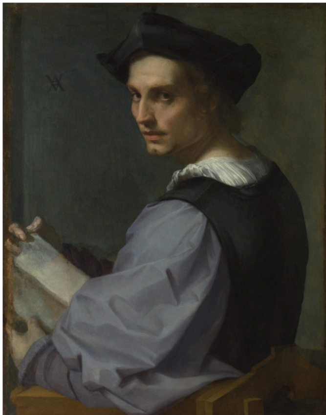
Slika 17. Andrea del Sarto, Portret mladića , c. 1517-18., ulje na platnu, 72,4 x 57,2 cm, National Gallery, London