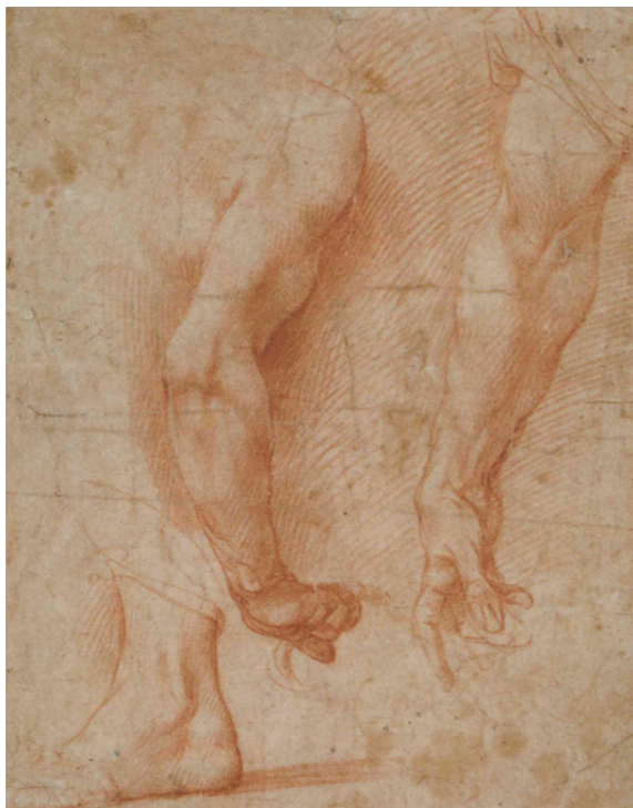
Slika 11. Andrea del Sarto, Studija lijevog stopala (prema Michelangelu) , c. 1518-19., crvena kreda na papiru, Städelsches Kunstinstitut und Städtische Galerie, Frankfurt