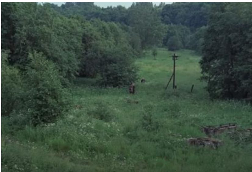
Slika 2. Stalker 0:53

Osjećaj beskrajna Zone u Stalkeru pojačava i njezino kontrastiranje s uskim prostorom objekta kroz koji prolaze glavni likovi na putu do Zone, a koji zbog ograničenosti i ispunjenosti vodom potiče klaustrofobiju. Čini se kako se Tarkovski poigrava s različitim konceptima dimenzija koji bi u promatraču mogli izazvati uznemirenost kako bi Zonu oslikao kao odbojan prostor. U romanu postoje jasni opisi kretanja, na primjer pri prvom prikazanom ulasku u Zonu doznajemo kako se s desne strane nalazi Institut, s lijeve Kužna četvrt, a Red, Tender i Kiril putuju u letećoj kaljači od oznake do oznake sredinom ulice (35). U filmu pak, iako je prikazano kako se Profesor, Pisac i Stalker kreću kroz prostor, zbog presjeka kadrova ne dobiva se jasna ideja smjera, prostora ili razdaljina i sve to dodatno gradi nelagodnu atmosferu.