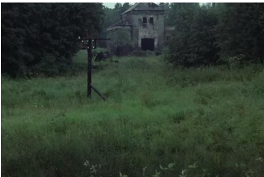
Slika 8. Stalker 0:44

Koliki je doista utjecaj boje na prikaz prostora veoma je očito na dvjema fotografijama građevine s početka filma. Slika 7. jednostavno je fotografija lokacije na kojoj je sniman film, a na Slici 8. je kadar filma. Iako se isto mjesto nalazi na objema slikama, one ostavljaju sasvim drugačiji dojam na promatrača zbog razlike u boji. Na Slici 7. boje nisu dorađene dok je na Slici 8. prostor značajno potamnjen, stoga se građevina u filmu doima puno turobnijom nego što to ona u stvarnosti jest. Kada se kadriranju i poigravanju bojama nadoda još i Stalkerova izjava: