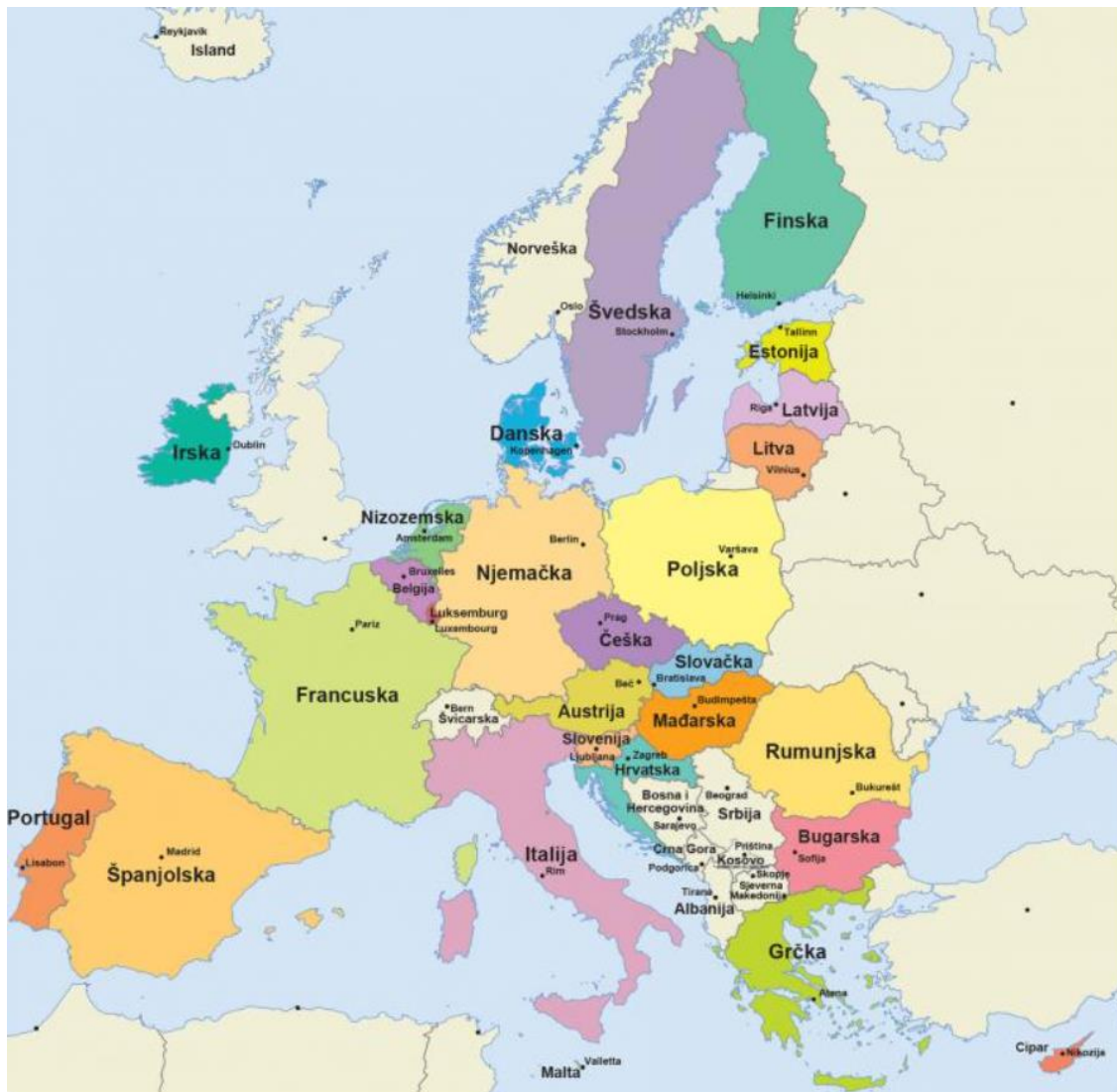
Slika 11. Zemlje EU i BiH potencijalni kandidat