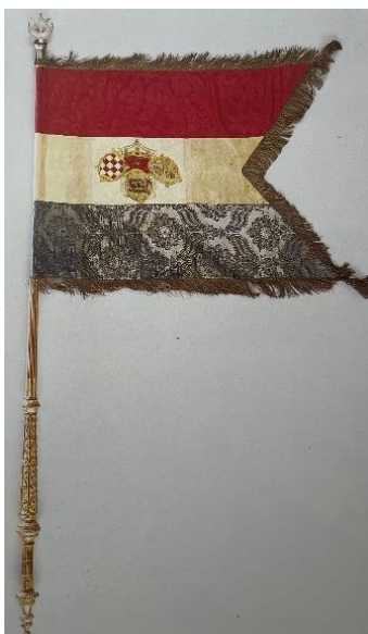
Slika 8 Zastava bana Josipa Jelačića, 1848. g. (Jelena BOROŠAK-MARIJANOVIĆ, Zastave kroz stoljeća. Zbirka zastava i zastavnih vrpca hrvatskoga povijesnog muzeja, Zagreb, 1996., 92.)

Druga varijacija grba je „sjedinjeni grb u kojemu su grbovi Dalmacije, Hrvatske i Slavonije sjedinjeni u zajedničkom štitu“. U prvoj varijaciji su grbovi odvojeni, dok su ovdje sjedinjeni u jedinstveni štit, također različitog rasporeda, a koristili su se istovremeno 1860-ih godina. Bitna instanca korištenja druge varijacije grba Trojednog Kraljevstva jest na kovanom novcu bana Jelačića, križaru , koji se pojavio samo godinu dana nakon njegove banske zastave koja je koristila prvi tip grba s odvojenim štitovima. 101