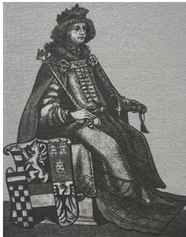
Slika 4 Prikaz Ludovika II. Jagelovića s vladarskim znakovljem i šahiranim grbom (Mario JAREB, Hrvatski nacionalni simboli, Zagreb, 2010., 16.)

zaslužna vladarska obitelj Jagelovića. Još jedna instanca pojave šahiranog grba se nalazi u prikazu Ludovika II. Jagelovića, koji je, smatra se, poprilično vjeran prikaz, sadrži vladarsko znakovlje i jedna od sastavnica je upravo šahirani grb. On se razlikuje od grba pod Maksimilijanom prema tome što je imao čak 28 kvadratnih polja (4x7) te je prvo polje bijele ili srebrne boje. 46