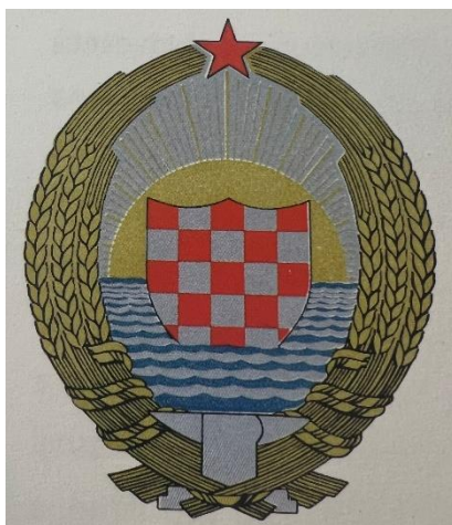
Slika 11 Grb NR/SR Hrvatske 1947. – 1990. (Željko HEIMER, Grb i zastava Republike Hrvatske, Zagreb, 2008., 43.)

označavala Bosnu i Hercegovinu. 143 Svaka od narodnih republika je imala pravo kreirati vlasti grb koji bi se sastojao od važnih simbola specifičnih za određenu narodnu republiku. 144 Tako je grb Narodne Republike Hrvatske kreiran s glavnim simbolom šahiranog štita s popratnim simbolima koji su se koristili često u socijalizmu. 145