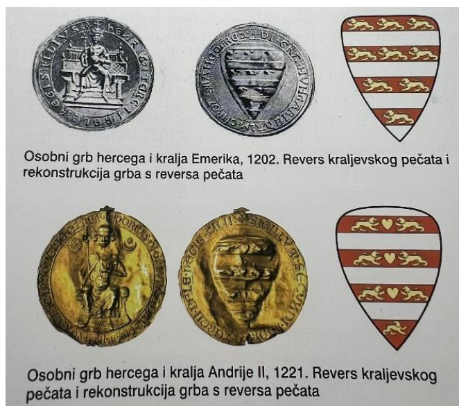
Slika 2 Motivi lavova na osobnim grbovima i novcu kraljeva Emerika i Andrije II. (Mate BOŽIĆ, Stjepan ĆOSIĆ, Hrvatski grbovi. Geneza, simbolika, povijest, Zagreb, 2021., 32.)