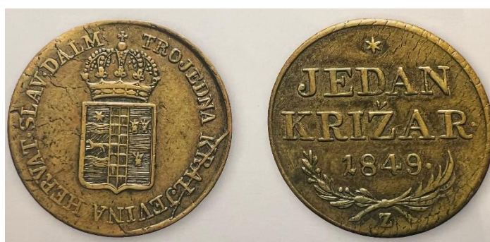
Slika 9 Avers i revers križara bana Josipa Jelačića iz 1849., tip grba sa sjedinjenim grbom Trojedne Kraljevine (Dubravka PEIĆ ČALDAROVIĆ, Nikša STANČIĆ, Povijest hrvatskoga

Druga varijacija grba je „sjedinjeni grb u kojemu su grbovi Dalmacije, Hrvatske i Slavonije sjedinjeni u zajedničkom štitu“. U prvoj varijaciji su grbovi odvojeni, dok su ovdje sjedinjeni u jedinstveni štit, također različitog rasporeda, a koristili su se istovremeno 1860-ih godina. Bitna instanca korištenja druge varijacije grba Trojednog Kraljevstva jest na kovanom novcu bana Jelačića, križaru , koji se pojavio samo godinu dana nakon njegove banske zastave koja je koristila prvi tip grba s odvojenim štitovima. 101