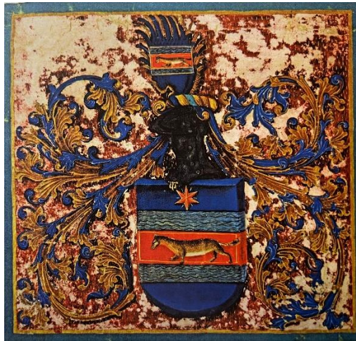
Slika 5 Grb Kraljevine Slavonije koji se nalazi u grbovnici kralja Ludovika II. Jagelovića (Dubravka PEIĆ ČALDAROVIĆ, Nikša STANČIĆ, Povijest hrvatskoga grba: Hrvatski grb u mijenama hrvatske povijesti od 14. do početka 21. stoljeća, Zagreb, 2011., 75)

Grb Slavonije pojavljuje se gotovo istovremeno s hrvatskim grbom s prvim crvenim poljem za vrijeme Habsburgovaca, koju je dao izraditi Vladislav II. Jagelović prema zahtjevu slavonskog plemstva. Vladislav II. Jagelović 8. prosinca 1496. također izdaje povelju Kraljevini Slavoniji, koja uključuje mogućnost korištenja pečata crvenim voskom. Vrlo je značajan i heraldički opis koji glasi: „u plavom, dvije valovite grede između kojih, u crvenom, udesno korača kuna naravne boje; iznad greda crvena zvijezda. U nakitu kaciga s modro-zlatnom točenicom iz koje raste modro zatvoreno krilo, a na njemu isti lik kune između greda“. Razlozi koji su Vladislava primorali da napravi ovakav čin za Slavoniju, naravno leže u činjenici da vladar pokuša zaštititi južne granice svojega kraljevstva, a bila je i dobra strateška odluka koja će biti od značaja protiv navala Osmanlija koje naziva „dušmanima kršćanstva“ i „vječitim neprijateljima“. 53