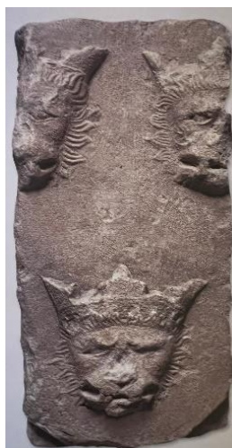
Slika 1 Kameni grb s tri okrunjene leopardove glave pronađen u Ostrovici (Mate BOŽIĆ, Stjepan ĆOSIĆ, Hrvatski grbovi. Geneza, simbolika, povijest, Zagreb, 2021., 30.)

Čini se da je to uvriježeno mišljenje pa tako i Peić Čaldarović i Stančić tvrde da „u literaturi se najstarijim grbom Hrvatske, tj. hrvatskim državnim grbom, smatrao grb s tri okrunjene leopardove glave“, a nadalje tvrde kako se „nalazi na pečatu povelje Žigmunda iz 1406. godine i na drugim prikazima Žigmundova grba“. 24 Također navode da zapravo takvi prikazi dolaze iz 14. st. iz doba kralja Ludovika I. Anžuvina, kao njegovoga kraljevskog grba koji je sadržan u grbovniku Gelrea, belgijskog herolda. 25 Navode isto da je kralj Ludovik I. Anžuvina „grbom Hrvatske s trima okrunjenim lavljim glavama označio obnovljenu cjelovitost hrvatskog teritorija pod svojom vlašću“ 26 , te da „grbovnim simbolom triju lavljih glava u svom kraljevskom grbu istaknuo je svoje pravo na to kraljevstvo i njegov politički identitet“. 27