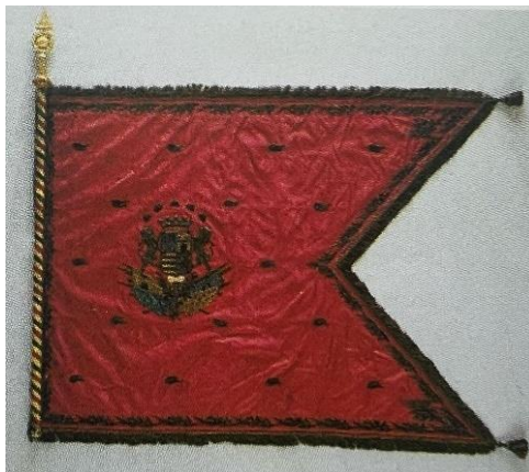
Slika 7 Zastava bana Franje Vlašića, 1832. g. (Jelena BOROŠAK-MARIJANOVIĆ, Zastave kroz stoljeća. Zbirka zastava i zastavnih vrpca hrvatskoga povijesnog muzeja, Zagreb, 1996., 93.)

zajedničkom krunom“. 99 Možemo promotriti i opisati zastavu bana Franje Vlašića iz 1832. kao primjer takvog tipa grba. U obliku je lastavičjeg repa, a u sredini aversa se može pronaći grb barunove obitelji, a grb Trojednog Kraljevstva se nalazi na reversu iznad kojeg se nalazi kruna sv. Stjepana. Redosljed grbova kraljevine je Dalmacija-Hrvatska-Slavonija.