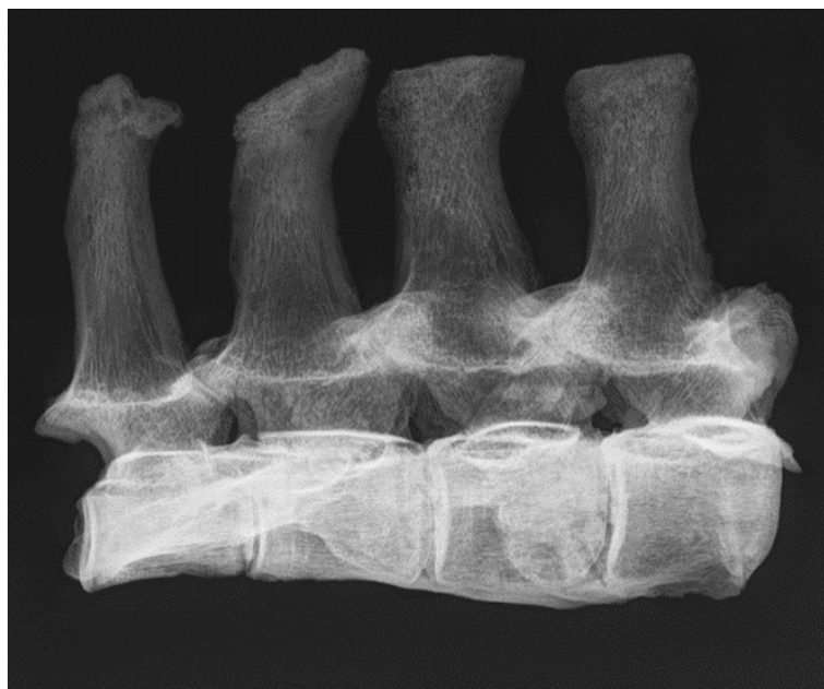
Slika 8. Rendgenogram 4. - 7. lumbalnog kralješka kobile iz G-52 ( norma lateralis sinister )