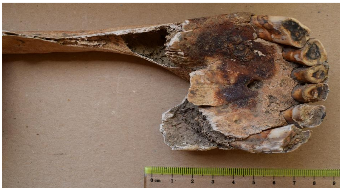
Slika 11. Gornja čeljust kobile iz G-52 s tragovima koji najvjerojatnije potječu od oksidiranih žvala

Osim promjena na lumbalnim kralješcima, na desnoj strani i u sredini gornje čeljusti kobile iz groba 52 uočeni su i tragovi koji najvjerojatnije potječu od oksidiranih žvala (Slika 11). Slične su promjene uočene s desne strane na gornjoj (Slika 12) i donjoj čeljusti (Slika 13) kobile iz groba 25. Rendgenskom pretragom ovih čeljusti, na dijelovima na kojima su bile žvale nisu uočene promjene na kostima i/ili zubima.