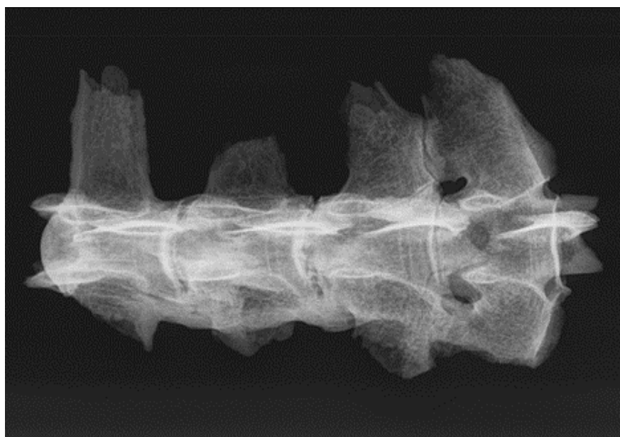
Slika 10. Rendgenogram 4. - 7. lumbalnog kralješka kobile iz G-52 ( norma ventralis )