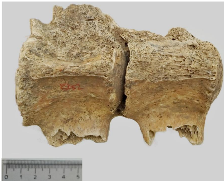
Slika 5. 2. i 3. lumbalni kralježak kobile iz G-52 ( norma ventralis )

Na istim kralješcima s ventralne strane nisu uočeni osteofiti (Slika 5), međutim na rendgenogramu iste projekcije, vidljivo je srašćavanje tijela oba kralješka i međurebrenog diska ( discus intervertebralis ) među njima (Slika 6).