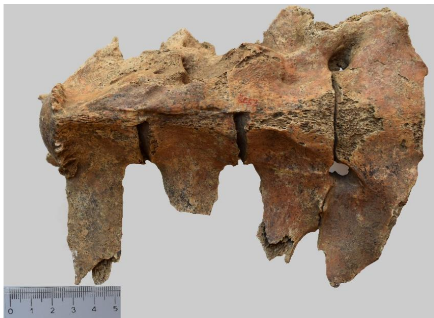
Slika 9. Patološke promjene 4. - 7. lumbalnog kralješka kobile iz G-52 ( norma ventralis )

Masivni osteofiti lijeve strane tijela 4. - 6. lumbalnog kralješka potvrđeni su ventralnom projekcijom (Slika 9) i rendgenogramom (Slika 10). Na Slici 9. vidljivo je kako su srasli i poprečni izdanci ( processus transversus ) 6. i 7. lumbalnog kralješka s lijeve strane.