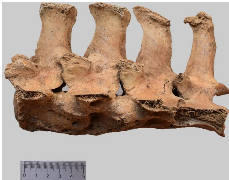
Slika 7. Patološke promjene 4. - 7. lumbalnog kralješka kobile iz G-52 ( norma lateralis sinister )

Nadalje, između 4. i 7. lumbalnog kralješka iste kobile vidljivo je kako su također srasli kranijalni i kaudalni zglobni izdanci ( processus cranialis et caudalis ), a masivni osteofiti su uočeni s lijeve lateralne strane tijela svih kralježaka (Slika 7). Koštana sraštenja zglobnih izdanaka i tijela kralježaka potvrđena su i rendgenogramom (Slika 8).