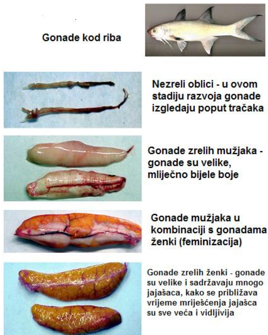
Slika 2. Makroskopski prikaz gonada riba

«Interseksualnost» je istovremena prisutnost muških i ženskih gonada kod individua (TYLER i JOBLING, 2008.). Njena najčešće zabilježena pojava je ona kod odraslih mužjaka u čijem su testikularnom tkivu prisutne jedna ili više oocita. Također, često se mogu pronaći i spermatoocite unutar jajnika, kao i oocite unutar sjemenovoda (NOLAN i sur., 2001.), a ovisno o pojavi kod akvatičnih organizama razlikujemo proces feminizacije (Slika 2.) (NOLAN i sur., 2001.) i maskulinizacije (HINCK i sur., 2007.).