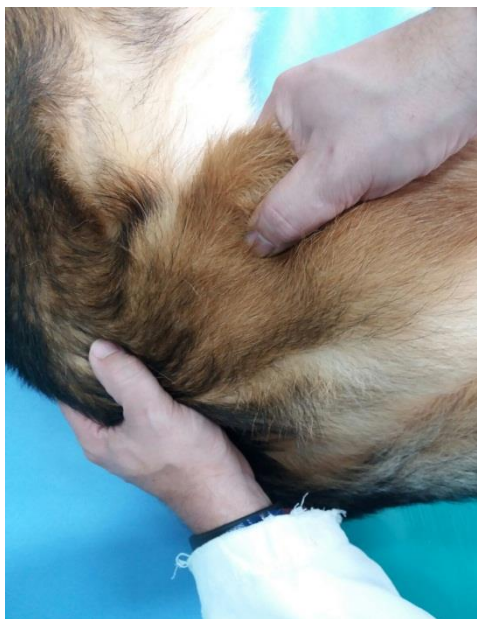
Slika 4. Izvođenje Ortolanijevog testa na boku

Ortolanijev test se izvodi tako da se životinja postavlja na bok ili leđa, zatim se uhvati ekstremitet za koljeno, adducira i potiskuje prema zdjelici, dok se drugom rukom zdjelica pridržava. Na taj način se vrši sublukcija kuka. Kuk se kod abdukcije, podizanjem koljena uz pritisak na trohanter, vraća u acetabulum. Pritom nastaje vidljivi pomak popraćen tupim prizvukom. Ovaj test je preuzet iz humane ortopedske dijagnostike nestabilnosti kukova u djece i naziva se prema autoru, Ortolanijev znak ili Orolanijev manevar (PUERTO et al., 1999).