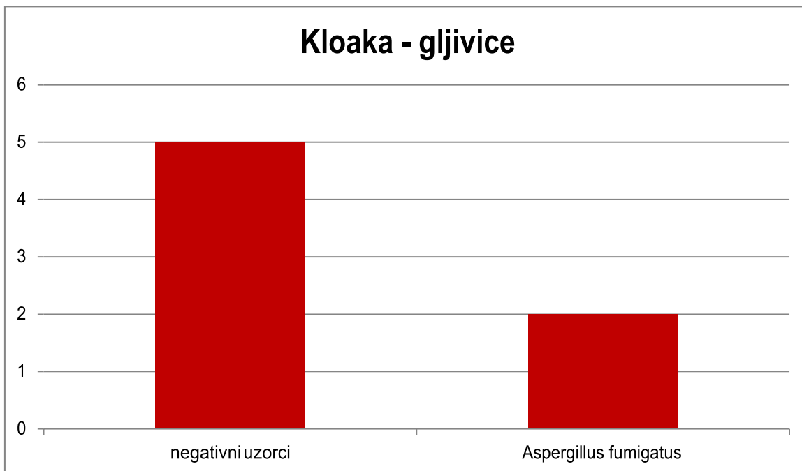
Tablica 3. Zastupljenost gljivica izdvojenih iz kloake riječnih kornjača

Iz usne šupljine riječnih kornjača nije izdvojena niti jedna gljivica. Iz kloake kornjača izdvojena je samo jedna gljivica i to Aspergillus fumigatus u dvije kornjače (Tablica 3.).