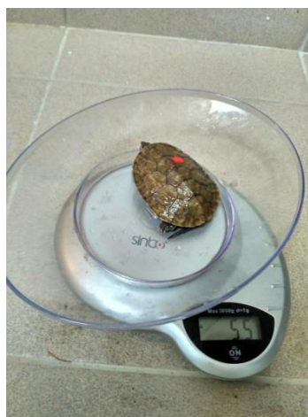
Slika 3. Vaganje kornjače

Nakon manuelnog sputavanja životinje su klinički pregledane inspekcijom i palpacijom vidljivih dijelova tijela na eventualne promjene i mehaničke ozlijede. Sve su životinje izvagane i izmjerene pomičnom mjerkom (Slika 3. i 4.), te je određen spol, ako je to bilo moguće.