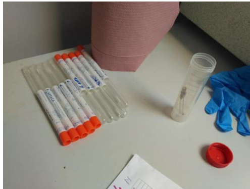
Slika 2. Materijal korišten pri uzrokovanju životinja

U svrhu istraživanja zdravstvenog stanja riječnih kornjača uzeti su obrisci usne šupljine i kloake od šest životinja smještenih u karantenskom prostoru Ustanove Zoološki vrt grada Zagreba nakon zapljene na granici. Kornjačama nije utvrđeno podrijetlo.