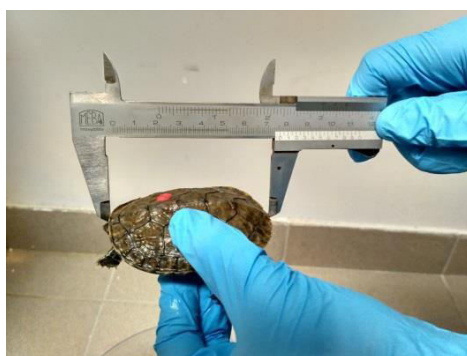
Slika 4. Mjerenje kornjače