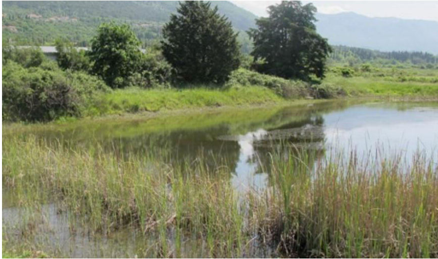
Slika 1. Konavosko polje-jezero