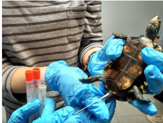
Slika 6. Uzimanje uzoraka kloake