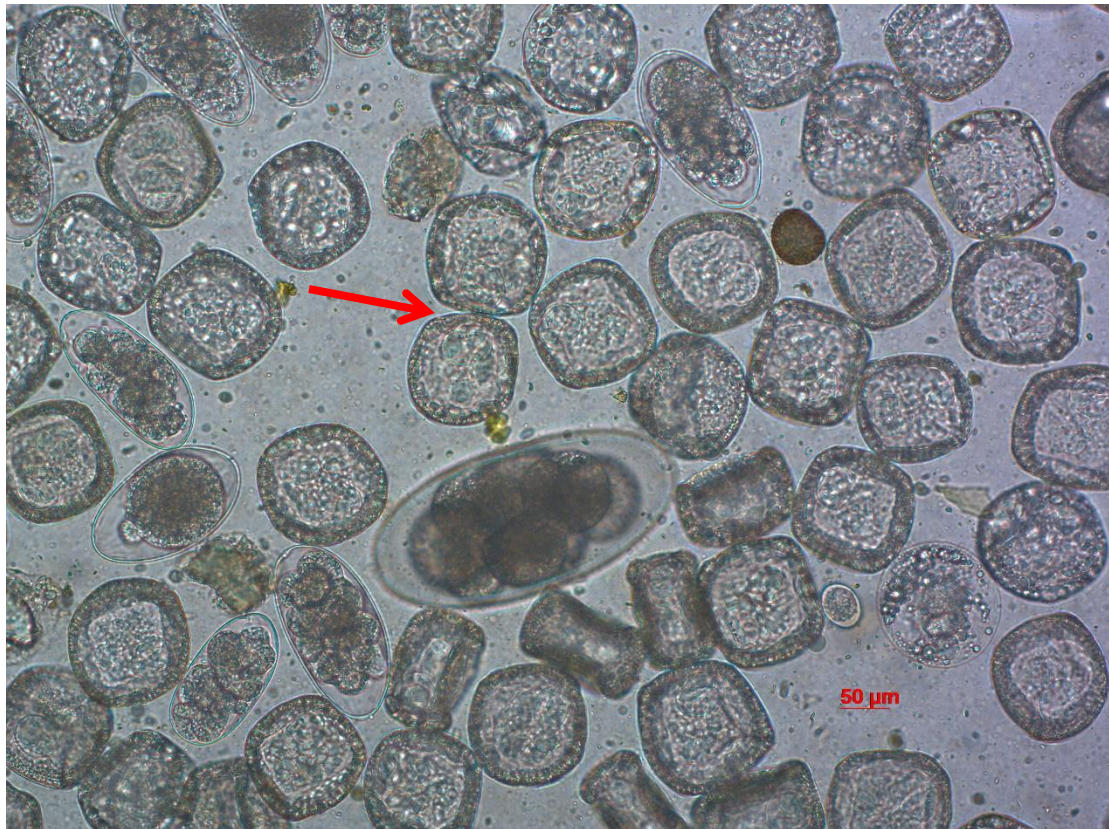
Slika 1. Jajašca trakavica roda Moniezia (označene strelicom), povećanje 400x