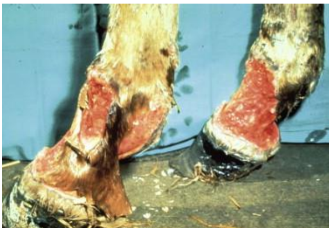
Slika 4. Oguljena koža kao posljedica purpure

Purpura hemorrhagica je imunoposredovano stanje čija patogeneza nije u potpunosti razjašnjena, no smatra se da nastaje kao posljedica odlaganja imunih kompleksa na stijenke krvnih žila. Važno je napomenuti da do takvog stanja ne dolazi isključivo u prisutnosti S. equi u organizmu – i neki drugi patogen može polučiti isti imunosni odgovor inficiranog organizma. Radi se o aseptičnom nekrotizirajućem vaskulitisu uslijed kojeg dolazi do edema, petehijalnih i ekhimotičnih krvarenja. Edemi se javljaju na glavi, trupu i ekstremitetima, a mogu biti toliko teški da uzrokuju guljenje kože na tim područjima. Osim navedenog, vaskulitis može zahvatiti i gastrointestinalni trakt, pluća i mišiće što rezultira intususcepcijom tankog crijeva (DUJARDIN, 2011.), respiratornim poteškoćama i bolnošću mišićja. Liječenje se provodi kortikosteroidima, antibioticima, nesteroidnim protuupalnim lijekovima te potpornom terapijom koja uključuje intravensku tekućinsku terapiju, hidroterapiju i stavljanje povoja. Purpura hemorrhagica je ozbiljna komplikacija koja nerijetko završava fatalno (BOYLE i sur., 2018.).