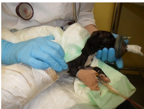
Slika 2. Maska s kisikom, izvor: izv. prof. dr. sc. Mirna Brkljačić, Klinika za unutarnje bolesti.

pokretljivosti crijeva, što pak rezultira kolapsom cirkulacije i uginućem. Smanjen puls i pad krvnog tlaka čest su nalaz kod hipoksične novorođenčadi te im je potrebna neposredna skrb (ENGLAND i VON HEIMENDAHL, 2010.). Terapija uključuje nadoknadu kisika putem kaveza sa kisikom, maske (Slika 2.), endotrahealnog tubusa ili inkubatora, nježno trljanje novorođenčeta (također može pomoći u poticanju disanja) dok su trešnja ili udaranje kontraindicirani (MCMICHAEL, 2014.).