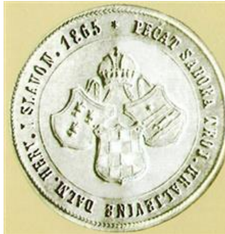
Slika 3 - Pečat Sabora Hrvatske, Dalmacije i Slavonije iz 1865.