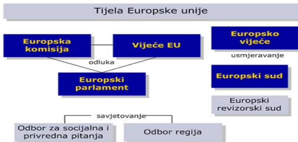
Slika 5. Tijela EU