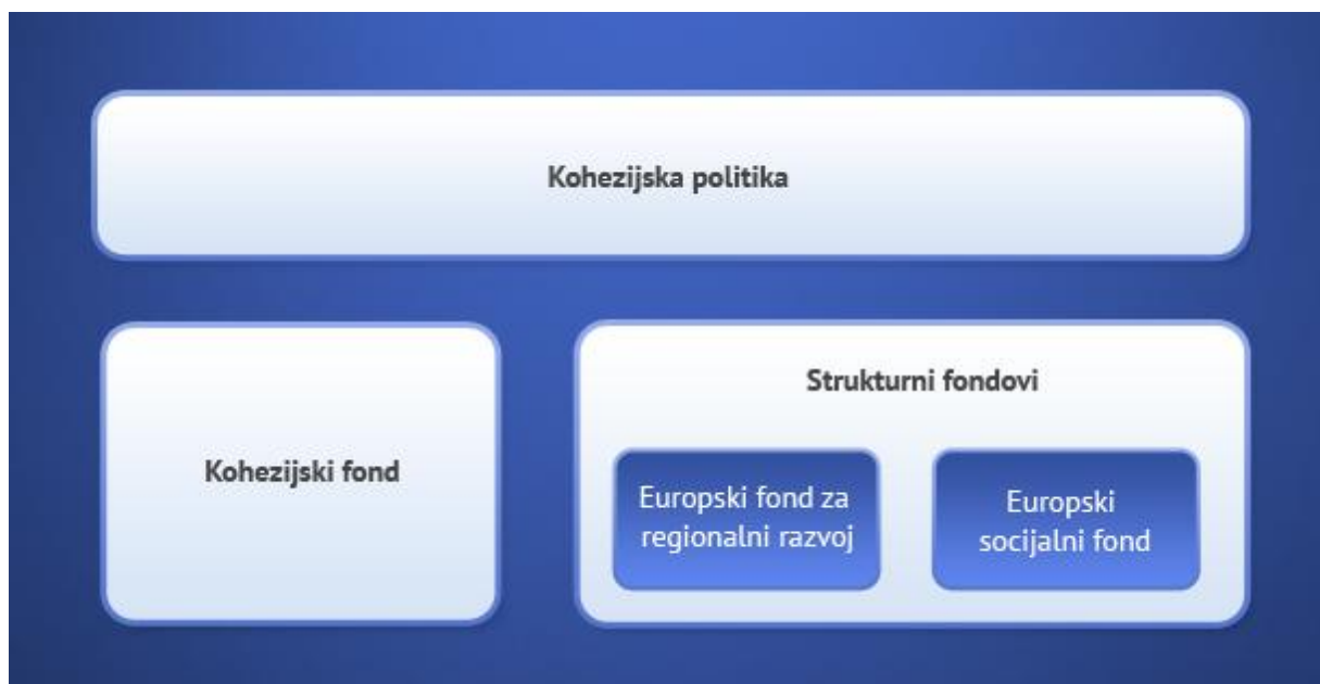
Slika 4. Instrumenti Kohezijske politike