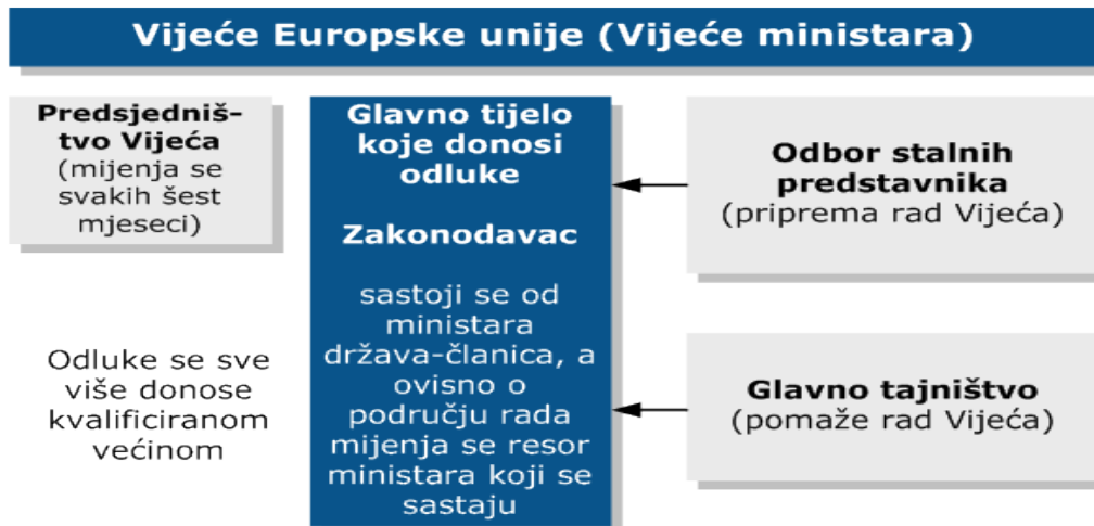
Slika 6. Vijeće Europske unije