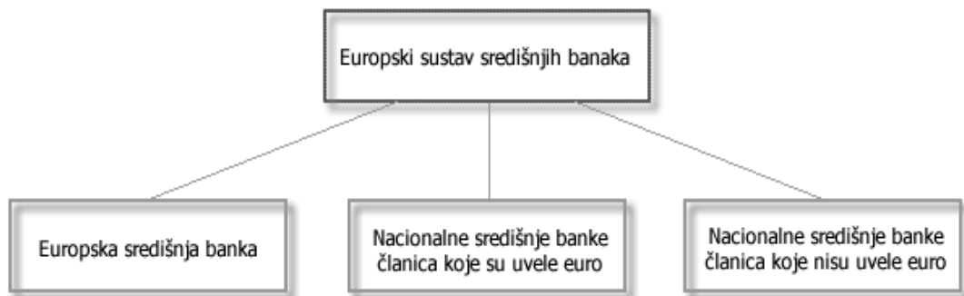
Slika 1. Europski sustav središnjih banaka

Europski sustav središnjih banaka (ESSB) skup je središnjih banaka kojeg čine Europska središnja banka (ESB) i nacionalne središnje banke (NSB) svih članica EU.