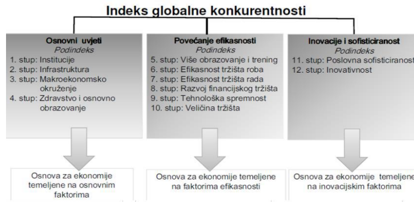
Slika 3. Indeks globalne konkurentnosti