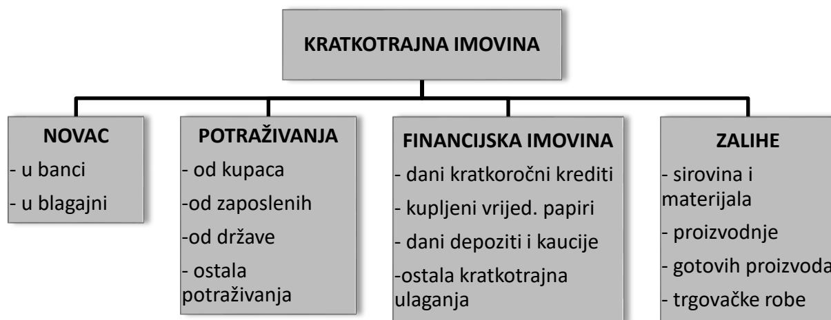
Slika 1. Oblici kratkotrajne imovine