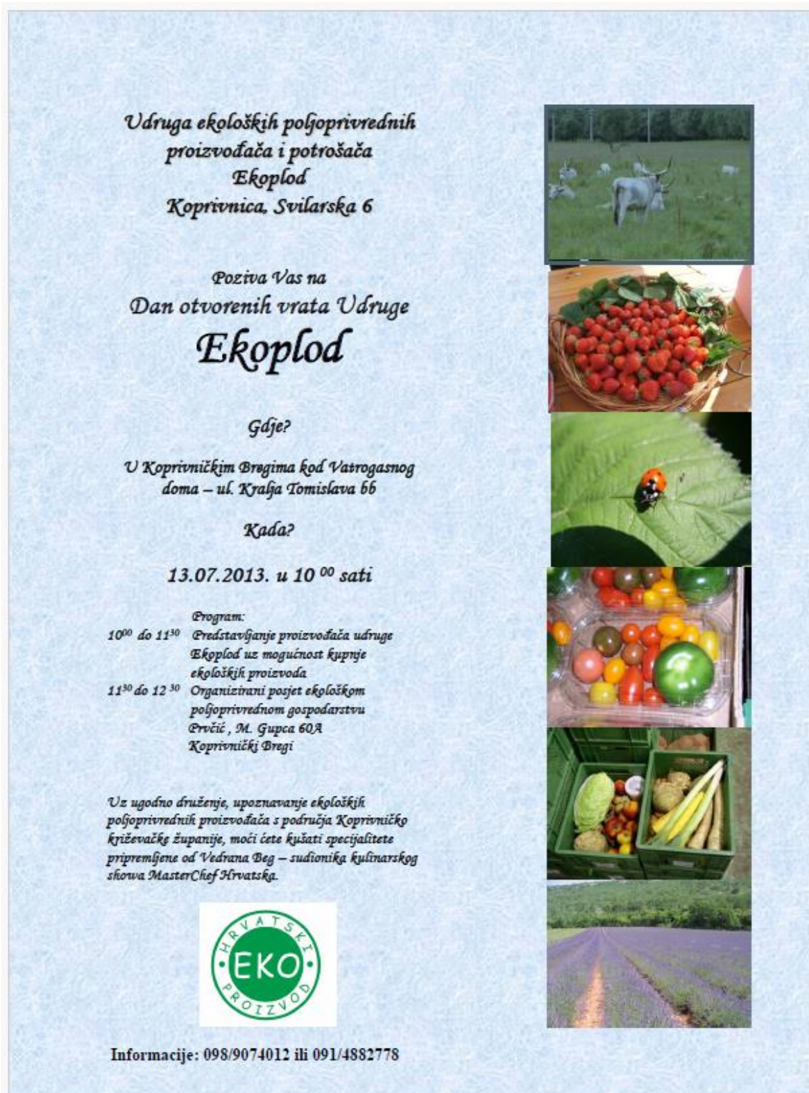
Slika 1 Pozivnica na Dane otvorenih vrata udruge Ekoplod

odobrena financijska sredstva za organizaciju Dana otvorenih vrata Udruge što je organizirano u srpnju 2013. godine u Koprivničkim Bregima (slika 1).