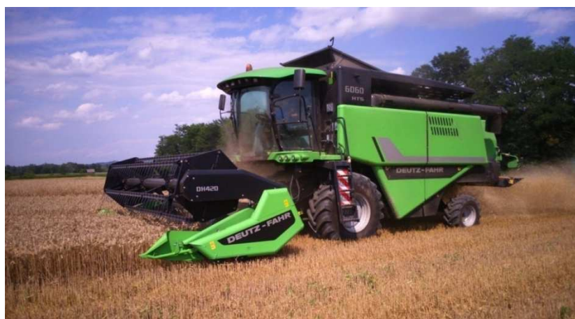
Slika 8. Kombajn, Deutzfah 6060 HTS

Žetva je obavljena 15. srpnja 2015. kombajnom Deutzfah 6060 HTS . Kombajn nije u vlasništvu OPG-a Šopar, već je korišten iz uslužnih djelatnosti.