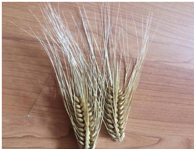
Slika 9. Klasovi čtetverorednog ječma