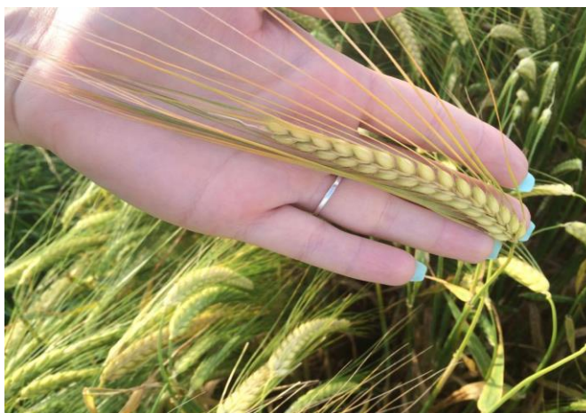
Slika 10. Klas dvorednog ječma