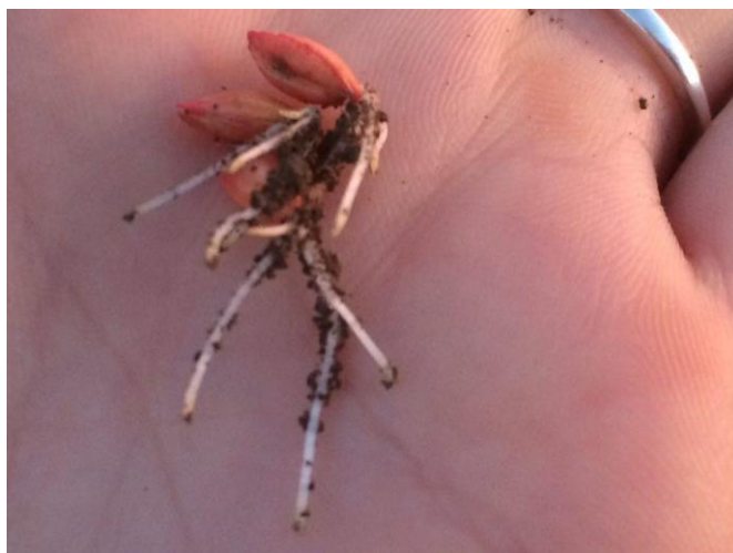
Slika 3. Korjenčić ječma, 29. 10. 2015.