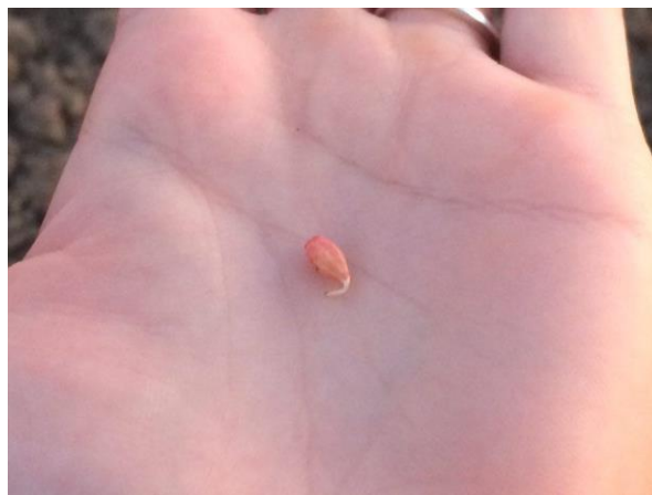
Slika 2. Klijanje ječma, 24.10.2015.