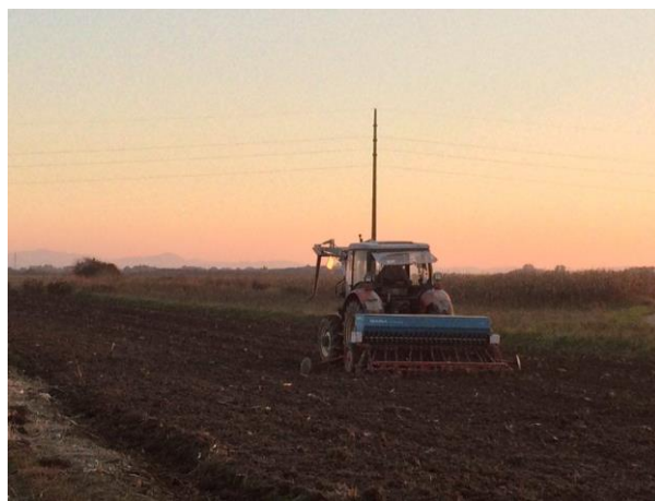
Slika 1. Sjetva ječma, 20.10.2015.

Nakon sjetve i nakon nicanja na 1\text{m}^2 bilo je izbrojano 8 redova. U 1 redu Bosuta bilo je 60 biljaka, što je ukupno 520\text{ b/m}^2 , a u 1 redu Jallona bilo je 35 biljaka što je ukupno 280\text{ b/m}^2 .