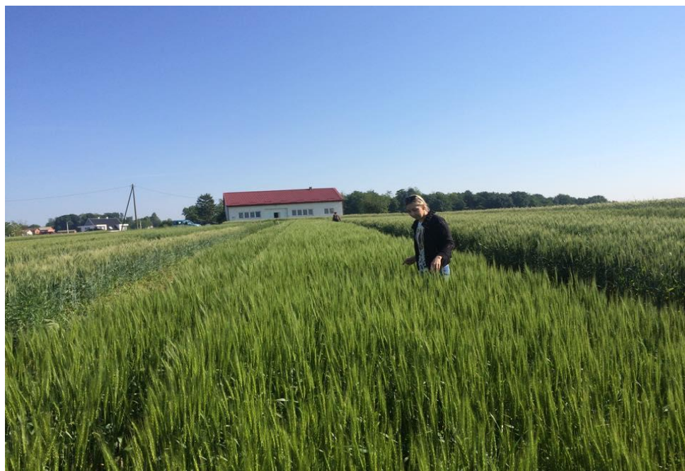
Slika 3: Pokusno polje konvencionalne proizvodnje na Visokom gospodarskom učilištu u Križevcima