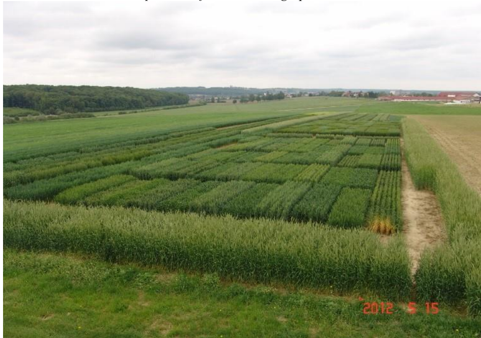
Slika 2: Konvencionalna proizvodnja na Visokom gospodarskom učilištu u Križevcima