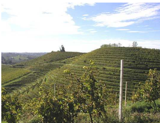
Slika 2. Vinogradi na "terasama" u Sv. Urbanu

krajolika. Iz svega unaprijed rečenog o vinskoj cesti, na nekoliko turističkih stranica može se pronaći tekst upućen turistima 14 : „U tridesetak lijepo uređenih vinskih kuća i vinotočja može se kušati preko 60 vina sa zaštićenim podrijetlom, bijelih, crnih ili rozea, stolnih, sortnih, izbornih berbi, vrhunskih ledenih. Osim vođenih degustacija, kupnje vina i odlične domaće hrane ljubazni domaćini na svojim obiteljskim seoskim gospodarstvima rado će vam prirediti i različite animacijske ili zabavne sadržaje. Ako na vinsku cestu krećete u vlastitom aranžmanu dobro je telefonom najaviti se izabranom domaćinu, a da svoje odredište lako pronađete pomoći će vam smeđa turistička cestovna signalizacija kojom je cijela vinska cesta odlično označena“.