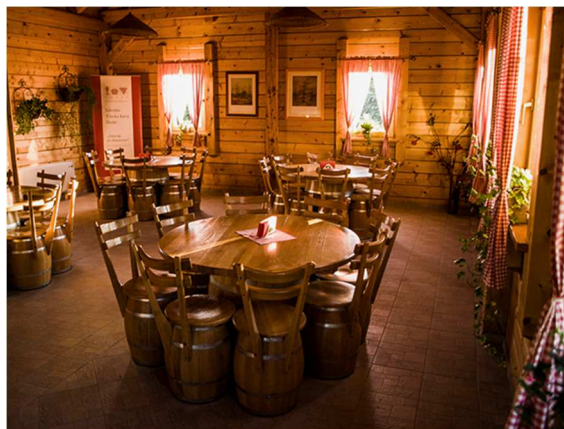
Slika 8. Interijer vinske kuće