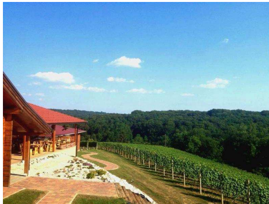
Slika 7. Eksterijer vinske kuće Hažić

Prije degustacije vina, vlasnica svojim gostima priča čime se oni kao vinska kuća bave, koje su specifičnosti međimurskog vinogorja, opisuje i okarakterizira vina, objasni im kulturu pijenja vina i otvaranja butelja. Uz kušanje vina gosti kušaju i domaće međimurske isključivo hladne nereske. Radno vrijeme Vinske kuće Hažić je petak, subota i nedjelja od 13:00 do 21:00 sat i postoji mogućnost individualnih posjetitelja prema dogovoru. Vinska kuća Hažić je 2012. godine dobila nagradu Zeleni cvijet od strane Turističke zajednice Međimurske županije za najuređenije poljoprivredno obiteljsko gospodarstvo u Međimurju, što se može vidjeti na sljedećim slikama 7. i 8. koje prikazuju njezin interijer i eksterijer.