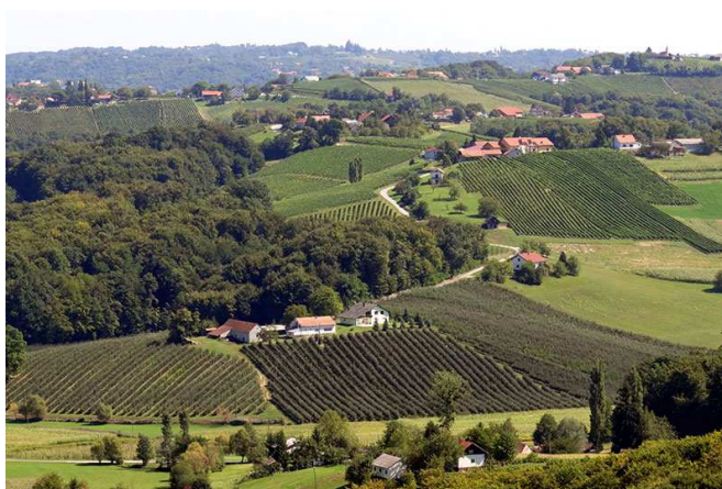
Slika 3. Vinogradi u Štrigovi