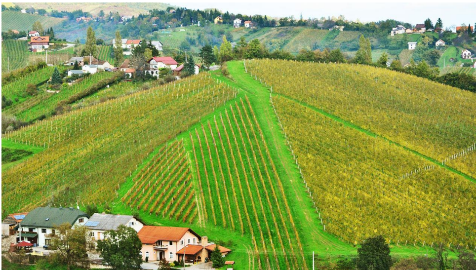
Slika 2. Primjer poljoprivredne površine u Zagrebačkoj županiji

Što se tiče voćarske kulture, najviše se uzgajaju jabuke (oko 80% voćarstva otpada na jabuke), a zastupljene su i kruške, šljive, marelice, breskve, trešnje, višnje, orasi i bobičasto voće ( www.invest-croatia-zg-county.com , 2019). Na slici 2 je prikazano poljoprivredno područje Zagrebačke županije.