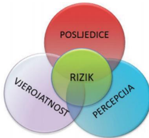
Slika 1. Prikaz značenja pojma rizika

nastanka događaja koji mogu nepovoljno utjecati na sve aktivnosti tvrtke kao i na ostvarenje njezinih ciljeva poslovanja. Prema ISO/ IEC uputama 73 rizik je “utjecaj nesigurnosti na ciljeve“. Ta nesigurnost može imati za posljedicu pozitivno ili negativno odstupanje od očekivanih rezultata. (Karić, 2006.)