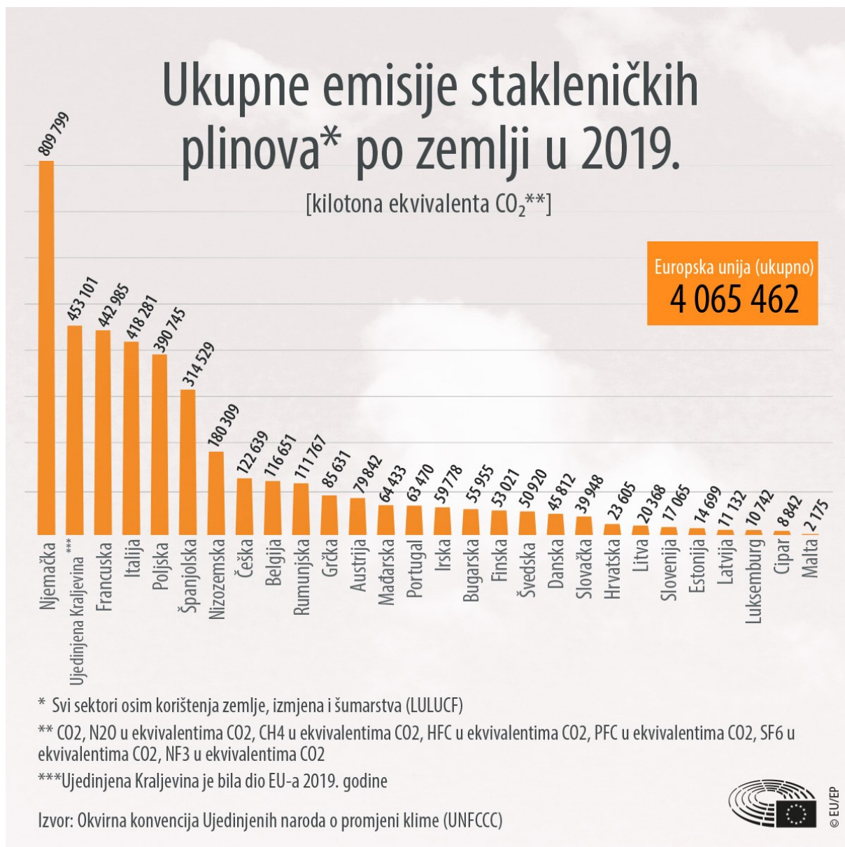
Slika 1. Usporedba ukupnih emisija stakleničkih plinova svih članica EU u 2019. godini

daljnju predanost RH u borbi protiv klimatskih promjena te smanjenju štetnih emisija stakleničkih plinova 71 .