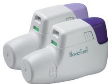
Slika 6 . Novolizer®