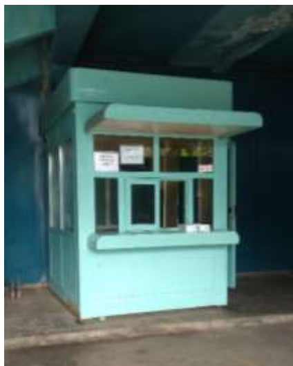
Sl. 5. Porta na ulazu od hitne pomoći [13]

Dolazak vozilom do hitne pomoći je moguć kroz tunel za vozila i to iz oba smjera Avenije Gojka Šuška. Porta na ulazu od hitne pomoći nalazi se uz istočni dio „I“ objekta bolnice na kraju tunela za vozila odnosno na početku parkirnih mjesta za vozila hitne pomoći. Ovo je prilično složeno radno mjesto jer kroz dnevnu i noćnu smjenu kroz taj ulaz prođe velik broj ljudi. Postoji opasnost da osobe unesu razne opasne predmete na objekt, a pošto su velik broj tih osoba pacijenti koji imaju neku vrstu hitnosti veoma je teško svaku osobu pregledati te zbog toga zaštitar na ovom radnom mjestu treba biti iskusan i procijeniti svaku osobu koja ulazi kroz ulaz hitne pomoći i na vrijeme uočiti je li ta osoba prijetnja sigurnosti ljudi i imovine. [4]