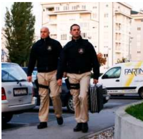
Sl. 3. Zaštitari u pratnji gotovog novca [7]