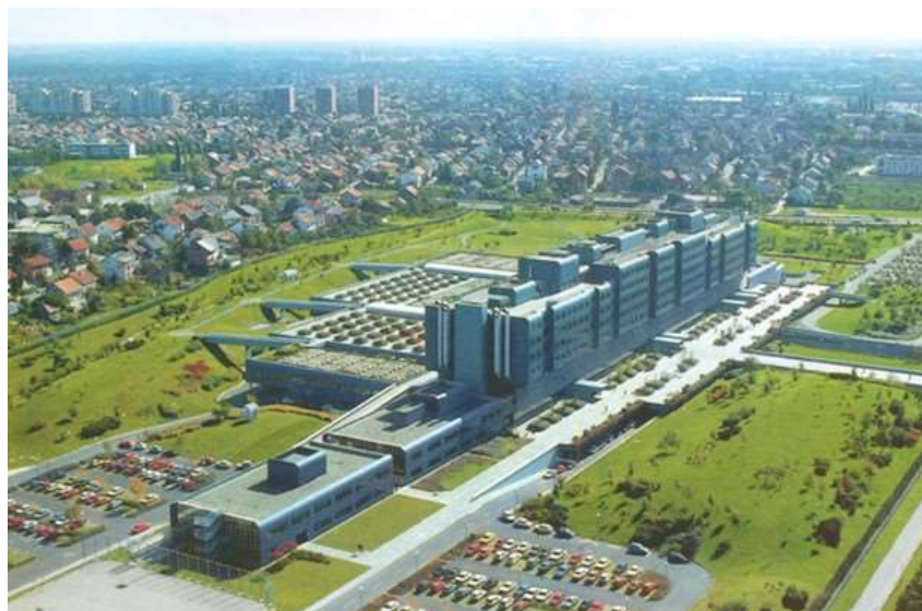
Sl. 1. Klinička bolnica Dubrava [5]