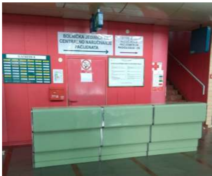
Sl. 8. Pult na glavnom ulazu bolnice [13]

Potencijalno opasne osobe koje bi bile rizične za objekt su one osobe koje dolaze iz zatvorskih ustanova na neki pregled ili liječenje u bolnicu. Te osobe, naravno dolaze u pratnji pravosudne policije te se dolazak takve osobe prethodno najavi. Kada osoba u pratnji pravosudne policije dođe u bolnicu, oni se javljaju zaštitaru na ovom radnom mjestu koji je upoznat o njihovom dolasku i odjelu odnosno pregledu kojeg osoba u takvoj pratnji treba obaviti te ih upućuje kako najbrže mogu doći do željenog odjela. Nakon toga zaštitar je dužan u knjigu dežurstva zapisati vrijeme ulaska i izlaska na odjel osobe pod pratnjom te naravno o kojem se odjelu radi. O tome također obavještava i ostale kolege na smjeni putem radio uređaja.