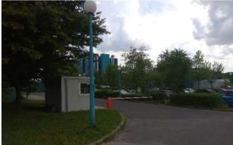
Sl. 7. Porta III i ulaz za službena vozila [13]