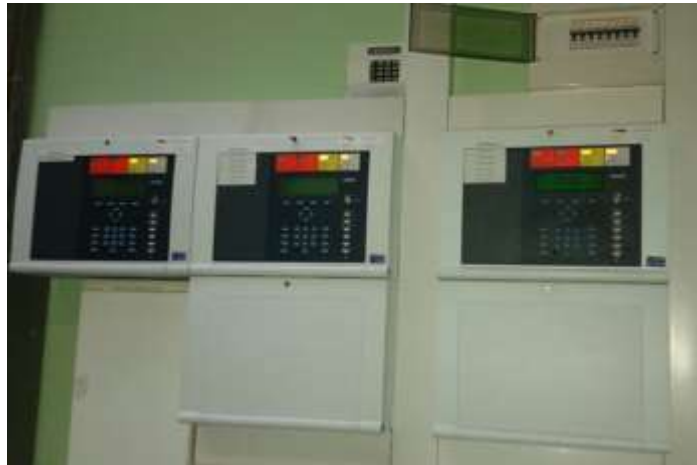
Sl. 9. Centrale za dojavu požara [13]

S obzirom na prostornu distributivnost predmetnih objekata na lokaciji KB Dubrava (objekti A, B, C, D, E, F, G, H i I), velik broj požarnih sektora i zona, velik broj elemenata u cijelom sustavu, velik broj sučeljenih podsustava te nužnost brze odluke i intervencije lokalne vatrogasne postrojbe (interventne jedinice), predmetni sustav za dojavu požara podijeljen je na prostorno distribuirane podsustave povezane na zasebne centrale (slika 9.) za dojavu požara, međusobno umrežene, te osigurava prikaz događaja sa svih centrala na središnjem sustavu za grafičku vizualizaciju 15 (LMS – local monitoring system). [1]