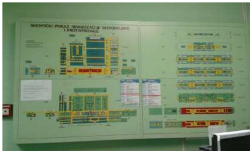
Sl. 11. Sinoptički prikaz vatrodjave i protuprovalne zaštite u kontrolnom centru [13]

Sa svim navedenim tehnološkim pogonima i postrojenjima centralna nadzorna jedinica upravlja posredno, preko 20 pod stanica koje su razmještene po objektima.