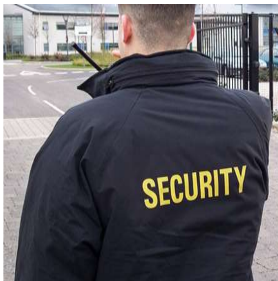
Sl. 2. Zaštitar za opće poslove [7]

Zaštitari osoba i imovine vode računa o sigurnosti ljudi, njihove imovine i objekata. Oni tjelesnom i/ili tehničkom zaštitom sprečavaju ili zaustavljaju provalu, krađu i oštećivanje imovine, kao i napad na štićenu osobu. Zaštitari osiguravaju prijenos imovine, kao što su npr. novac, vrijednosni papiri, povjerljiva pošta i opasni tereti. Oni štite osobe od tjelesnih ozljeda, ranjavanja, otmice ili jednostavno štite njezino pravo na privatnost. Na javnim skupovima, koncertima, sportskim događajima te u raznim klubovima održavaju red udaljujući osobe koje ugrožavaju sigurnost ostalih prisutnih. Također kontroliraju unos opasnih predmeta kojima se netko može ozlijediti. Zaštitari često čuvaju razne objekte, kao što su stambene i poslovne zgrade, proizvodni i poslovni prostori, gradilišta i parkirališta. Na tim mjestima provjeravaju identitet osoba koje ulaze i izlaze iz štićenog prostora. Ukoliko procijene da je potrebno, zabranjuju pristup nepoželjnim osobama, a u nekim slučajevima zadržavaju osobu i predaju je policiji. Pri eventualnom napadu, odnosno u krajnjoj nuždi, zaštitari se smiju braniti tjelesnom snagom i vatrenim oružjem (slika 4.). [8]