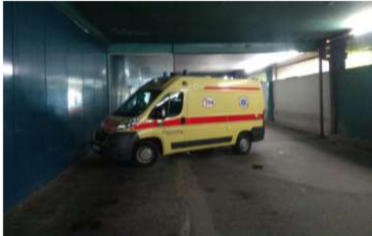
Sl. 6. Tunel za vozila hitne pomoći [13]

kroz taj tunel. Zbog toga, zaštitar mora odmah upućivati privatne automobile na produže kroz tunel na sjeverni parking bolnice. [4]