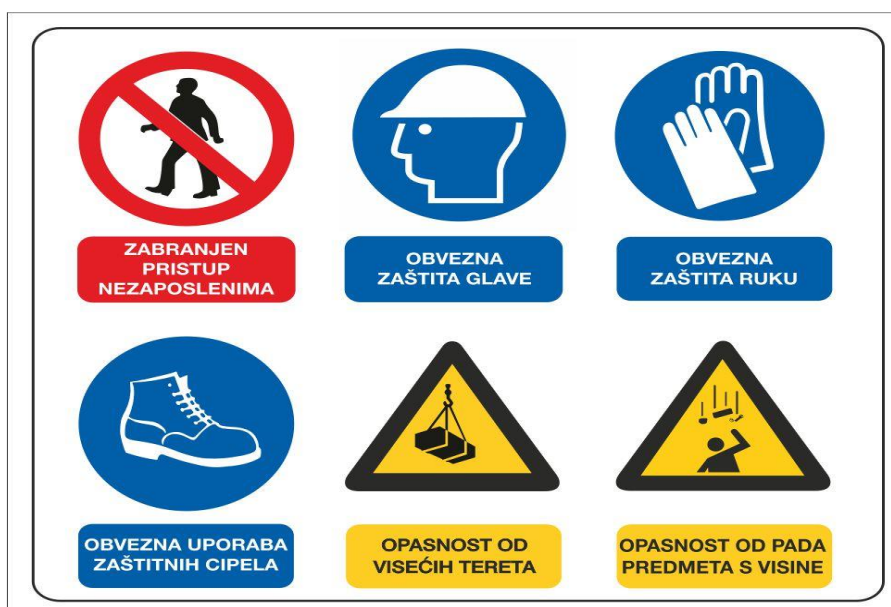
Slika 13. Znakovi (piktogrami) sigurnosti

Znakovi sigurnosti se moraju postaviti na odgovarajuća mjesta tako da budu uočljivi i otporni na atmosferlije.