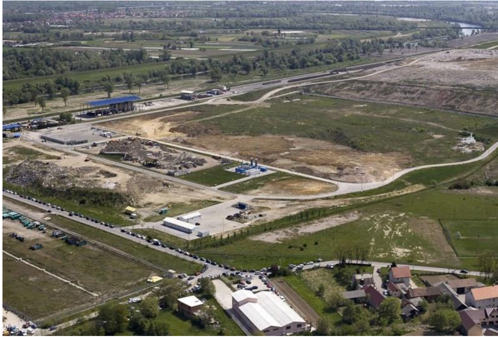
Slika 8. Odlagalište otpada Jakuševac – Prudinec