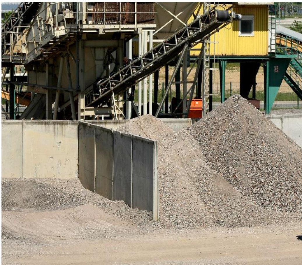
Slika 9. Građevinski otpad nakon obrade