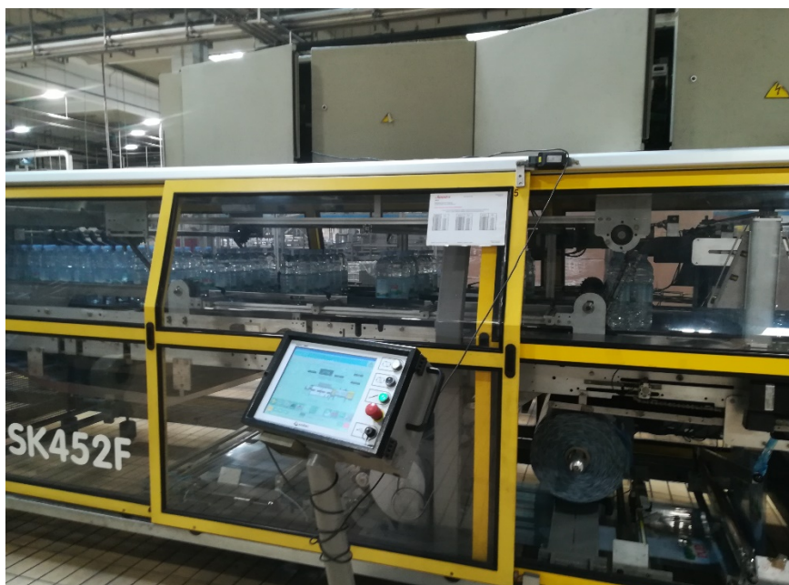
Slika 8. Upakivač.

Paletizator je stroj koji automatski prema zadanom programu slaže pakete na paletu ovisno o dimenziji paketa (slika 9.).