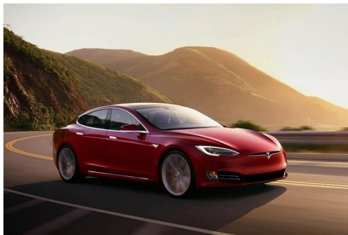
Slika 2. Tesla Model S