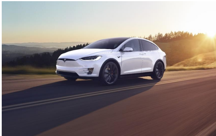
Slika 4. Tesla Model X