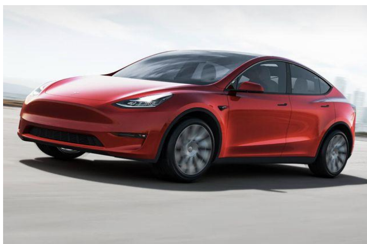
Slika 5. Tesla Model Y