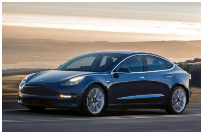
Slika 3. Tesla Model 3