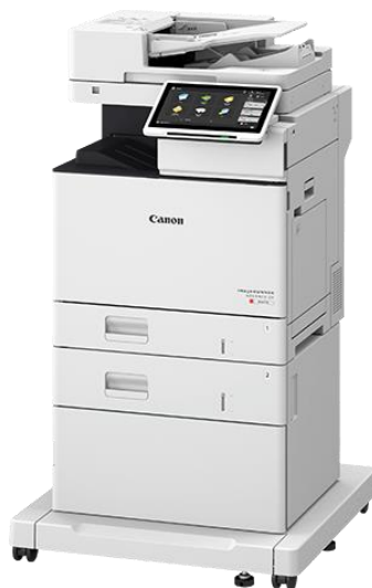
Slika 12 - Multifunkcionalni uređaj Canon - imageRUNNER ADVANCE DX C477[28]

Slika 12. prikazuje multifunkcionalni uređaj imageRUNNER ADVANCE DX C477 proizvođača Canon.