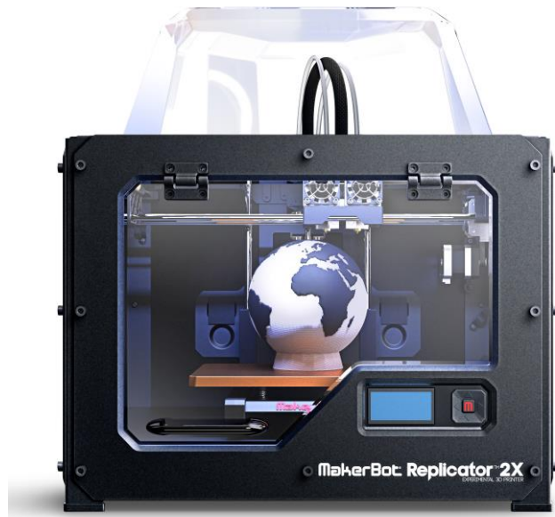
Slika 5 - 3D printer MarkerBot Replicator 2x [12]