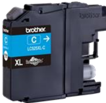
Slika 8 - Uložak tinte plave boje [17]

Slika 8. prikazuje uložak tinte plave boje proizvođača Brother.