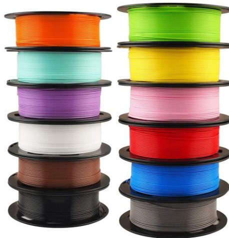
Slika 10 - Plastični filament 3D pisača [26]

Slika 10. prikazuje plastični filament 3D pisača, a slika 11. prikazuje prah koji se koristi u selektivnom laserskom srašćivanju.