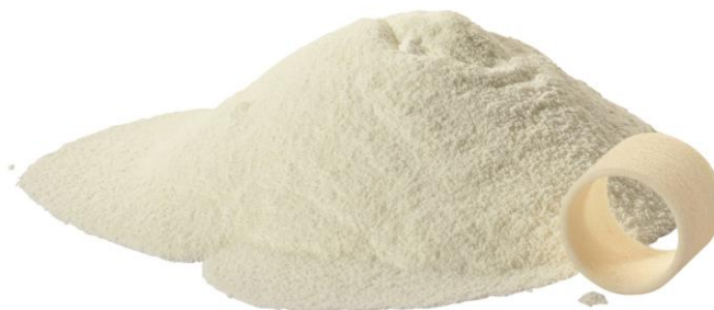
Slika 11 - Prah za selektivno lasersko srašćivanje [27]