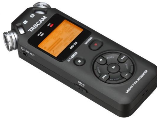
Slika 14: Digitalni snimač ili diktafon [14]

priključka za prebacivanje, pohranu i organizaciju podataka na osobno računalo. Također ima i mogućnost da se govor automatski pretvori u tekst, sa softverom za prepoznavanje govora.