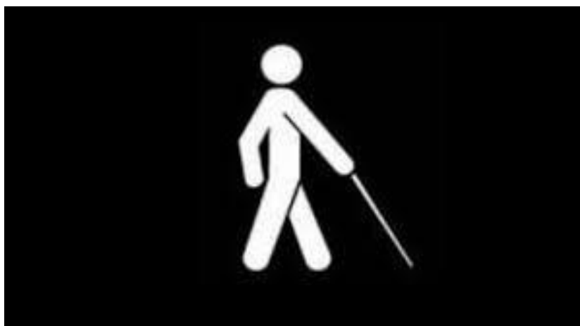
Slika 2: Ilustracija korištenja bijelog štapa [2]

Inicijativu za korištenje bijelog štapa kao zaštitnog znaka slijepih osoba u prometu dala je gospođica Guilly d'Herbmont 15. listopada 1930. godine. No, tek nakon drugog svjetskog rata se bijeli štap i to kao tzv. dugi bijeli štap, počinje koristiti kao pomagalo za kretanje slijepih. U RH se s obilježavanjem počelo 1996. godine, pa se Hrvatska priključila mnogobrojnim zemljama u kojima je Međunarodni dan bijelog štapa prerastao u Međunarodni dan slijepih, kojim se najšira javnost upoznaje s problematikom slijepih osoba.