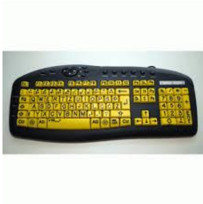
Slika 10: Tipkovnica za slabovidne [10]

Tipkovnice predstavljaju 'pomagalo' koje sa većim tipkama više odgovaraju osobama sa oštećenjem vida. Ove tipkovnice su također većih dimenzija, a mogu biti izrađene u kontrastima crno-žute (slika 10) i crno-bijele boje sa velikim tipkama, na kojima su kontrastnom bojom utisnuta slova, brojevi i sve ostale oznake koje se nalaze na standardnim testaturama (slika 10). Veličina i boja tipki omogućavaju optimalan kontrast i olakšavaju korištenje računala.