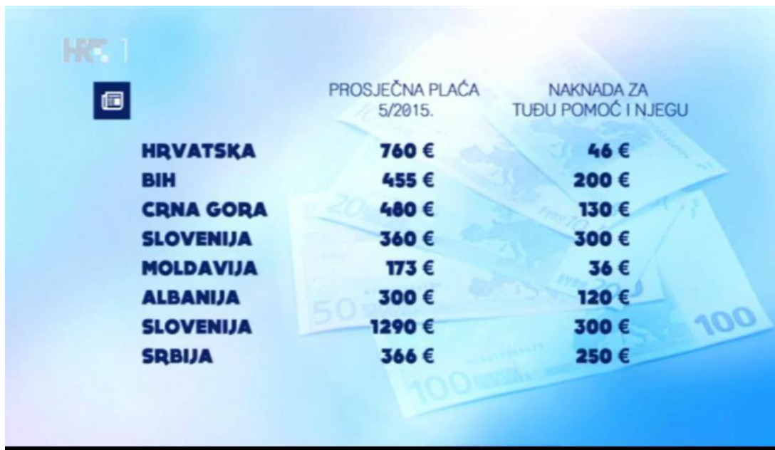
Slika 3: Prikaz inkluzivnog doplatka za slijepe osobe [3]

Jedan od velikih problema je inkluzivni doplatak. Već dvadeset godina Hrvatski Savez slijepih i temeljne udruge bore se za državnu potporu kojom bi slijepe osobe podmirile dodatne troškove prouzročene sljepoćom. RH isplaćuje najmanji inkluzivni doplatak za slijepe osobe u cijeloj Europi koji iznosi svega 46 eura (slika 3.), pa čak i susjedne zemlje kao što su BiH, Crna Gora, Srbija,...imaju veći inkluzivni doplatak za slijepe osobe [13] .