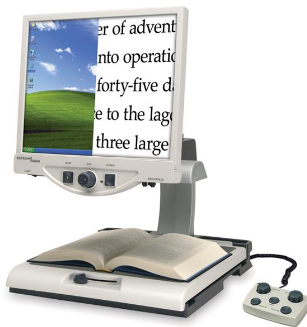
Slika 11: Primjer stolnog povećala [11]

Općenito se dijele na stolna (slika 11) i džepna elektronička povećala (slika 12).