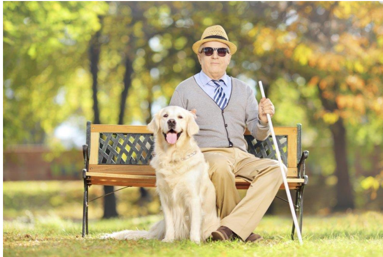
Slika 1: Pas vodič [1]

Zakon također propisuje i sankcije (novčane kazne) za prekršitelje, koji slijepim osobama u pratnji pasa vodiča uskrate pravo pristupa u javni prostor ili sredstvo javnog prijevoza. Važno je napomenuti da je RH jedna od rijetkih zemalja u Europi i svijetu koja ima zakonski uređeno pravo na pristupačnost slijepih osoba sa psima vodičima (tj. osoba s invaliditetom sa psima pomagačima) [9]. U cilju promicanja temeljnih ljudskih prava korisnika pasa vodiča u zemljama Europske unije i zemljama koje geografski pripadaju Europi, 2007. godine osnovana je Europska federacija korisnika pasa vodiča (eng. European Guide Dog Federation ), kao krovna organizacija, čija je i Hrvatska udruga za školovanje pasa vodiča i mobilitet aktivni član. Doprinos RH svakako je u postojanju Zakona o kretanju slijepe osobe uz pomoć psa vodiča donesenom 1998. godine. Pravo na pristupačnost jedno je od temeljnih ljudskih prava koja su naglašena u različitim međunarodnim dokumentima, a svakako su osnovni preduvjet za socijalnu uključenost osoba s invaliditetom u društvo.