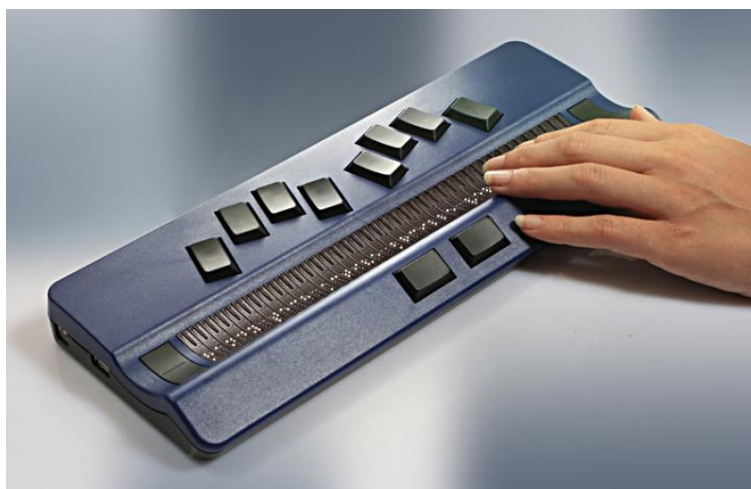
Slika 5: Brailleova elektronička bilježnica [5]

Također, moderne elektroničke bilježnice opremljene su integriranim 32-znakovnim ili 18-znakovnim brajevim retkom. Kao i brajev redak i elektroničke bilježnice koriste kompjutersku brajicu od 8 točkica. Uz pomoć Windows OS elektroničke bilježnice mogu direktno komunicirati s osobnim računalom. Tako se podaci mogu premještati s jednog uređaja na drugi, pohranjivati, obrađivati i koristiti. U nekim slučajevima povezivanjem elektroničke bilježnice i računala, bilježnica se može koristiti kao brajev redak ili sintetizator govora za tekst prikazan na ekranu računala [20]. Osim navedenih tipaka za unos brajice, ovisno o modelu i proizvođaču, neki od modela imaju i tipke za kretanje po menijima te tipke za manipulaciju brajevim retkom. Također na bilježnicama se nalaze priključci za strujno napajanje, priključak za slušalice i priključci za spajanje s osobnim računalom.