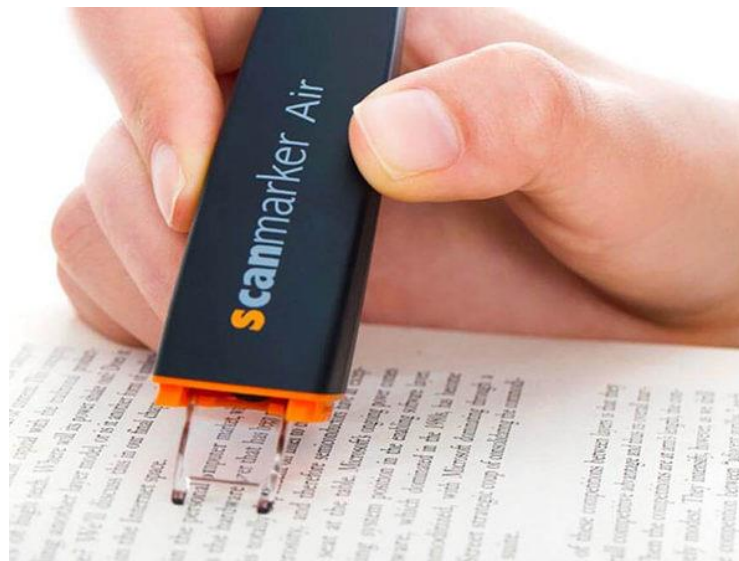
Slika 13: Olovka za čitanje ili scanmarker [13]

Digitalni marker u obliku olovke (slika13) funkcioniра na način da prevlačenjem vrha olovka preko bilo kojeg printanog teksta, uređaj odmah prebacuje tekst u bilo koji program na računalu. Ovaj uređaj je izdržljiv i lagan, ergonomski dizajniran. Njegova napredna tehnologija omogućuje brzo i izuzetno precizno prepoznavanje više jezika i istovremeno stvaranje teksta za uređivanje. Integrirana TTS (eng. text to speech ) (pretvaranje teksta u govor)- funkcija omogućuje korisniku da čuje tekst koji se čita naglas, što ga čini odličnim alatom za poboljšanje pamćenja, kao i razumijevanje skeniranog materijala [25].