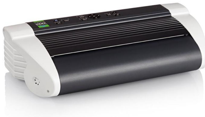
Slika 6: Brailleov prijenosni printer [6]

Basic-D je klasični dvostrani brajev printer ( emboseri ). Njegov WinBraille editor , je jedan od najboljih i najprilagodljivijih na tržištu. Za prosječnog korisnika postoji besplatna verzija ovog programa. Basic-om se upravlja pomoću dugma za upravljanje. Ispisani su na crnom tisku, brajevom pismu i pritiskom na njih oni izgovaraju svoju funkciju, čime omogućavaju slijepim i slabovidim korisnicima brzo, jednostavno i samostalno instaliranje i rukovanje. Basic je jedan od najpouzdanijih klasičnih brajevih printera koji printaju na perforiranom beskonačnom papiru. “Hrani se” papirom iz kutije i može dugo i neprekidno da printa. Njegova velika brzina, mala težina i kompaktna izrada čine ga najboljim prenosivim brajevim printerom na svijetu [21].