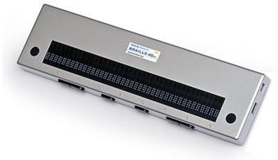
Slika 4: Brailleov redak s 40 slovnih mjesta [4]

Ovakvi uređaji korisni su iz više razloga