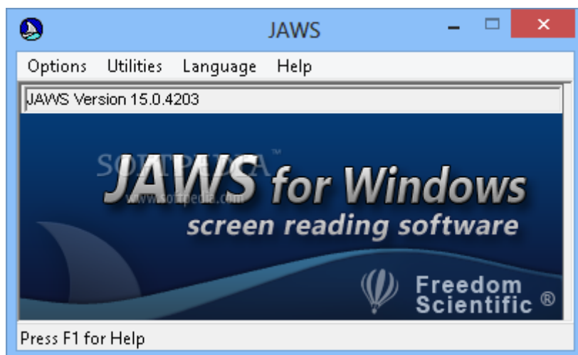
Slika 8: Čitač ekrana JAWS [8]

Čitač ekrana JAWS for Windows, je najpopularniji i najkorišteniji čitača ekrana (eng. screen readera ) na svijetu (slika 8). Distribuira se širom svijeta u više od 50 zemalja i preveden je na 23 jezika. JAWS omogućava slijepim i slabovidim osobama da ravnopravno koriste većinu aplikacija na računalu, prati aktivnosti korisnika na računalu i čita sadržaj ekrana. Aktivnosti korisnika i sadržaj ekrana pretvara u tekst i šalje na Brajev redak ili sintetizator govora [3].