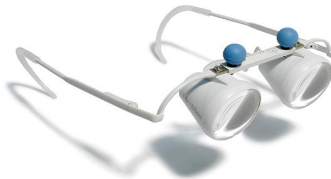
Slika 15: Teleskopske naočale [15]

Prednost ovih naočala su slobodne ruke i mogu se prilagoditi tako da se svako oko objektivna može fokusirati zasebno ( \pm 3 dioptrije). Montirana stakla pružaju uvećanje 2.1x čime je vrlo prilagodljiv sistem. Teleskopske naočale su najudobniji način gledanja udaljenih predmeta i aktivnosti [26].