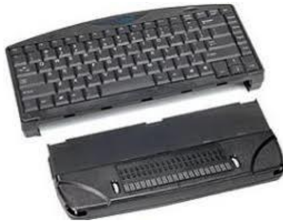
Slika 7: Univerzalna Brailleova tipkovnica [7]

Ovaj proizvod je na bazi računalnog programa, koji se implementira u operativni sustav korisnika, te se automatski pokreće i omogućava korištenje računalne tastature kao Brailleovog pisaćeg stroja u bilo kojoj aplikaciji. Korisnik u svakom trenutku može koristiti standardnu tipkovnicu, ili svoju tipkovnicu pretvoriti u Brailleov pisaći stroj, te na njoj pisati kao na mehaničkom Brailleovom pisaćem stroju koristeći šestotočkasto, ili osmotočkasto Brailleovo pismo [21].