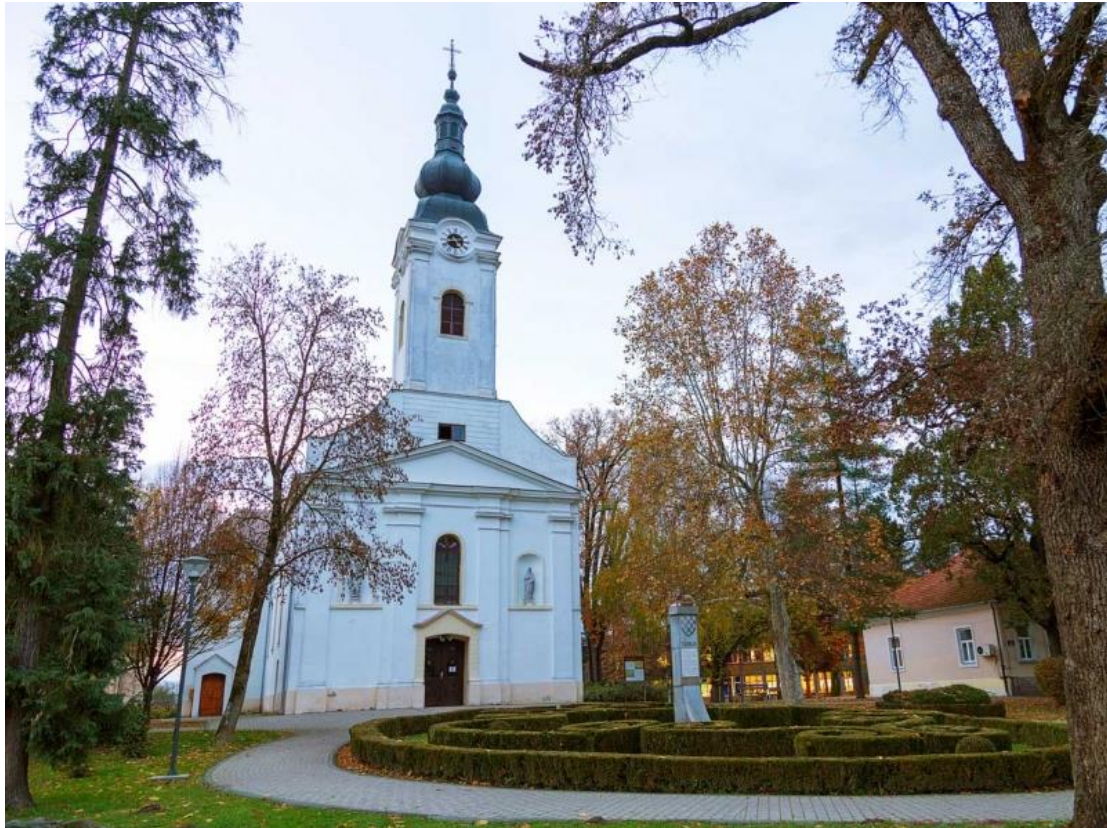
Slika 7: Župna crkva svetog Petra Apostola