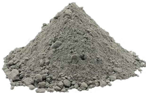
Sl. 1 Cement [2]

Cement, u suvremenom graditeljstvu, predstavlja osnovno vezivo kod izrade betona. Prema Vrkljanovu mišljenju, cement predstavlja naziv za sva ona veziva s hidrauličkim svojstvima što znači da takva se veziva u dodiru s vodom povezuju i stvrdnjavaju, bez obzira nalaze li se na zraku ili pod vodom jer u reakciji s vodom daju stabilne produkte (hidraulično vapno i sve vrste cementa). Za razliku od hidrauličnih, nehidraulična se veziva vežu i stvrdnjavaju djelovanjem vode na zraku, a pod vodom ne mogu očvrnuti jer su im u reakciji s vodom produkti topljivi i nestabilni u vodi (glina, vapno i gips). Naziv cement dolazi iz latinskih riječi „caedere“- lomiti i „lapidem“- kamen. To je glavno mineralno vezivo koje u miješanju s vodom i agregatom proizvodi beton. [2]. Na slici 1 prikazan je cement.