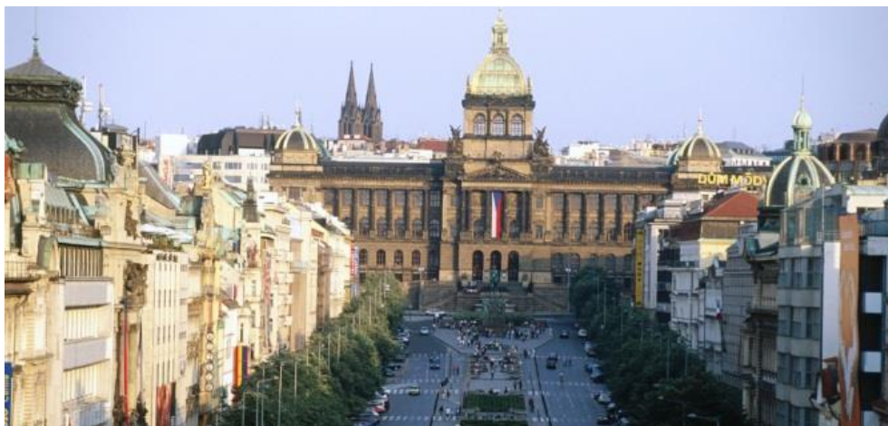
Slika 8. Vaclavski trg