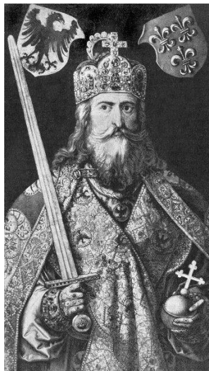
Slika 4. Karlo IV