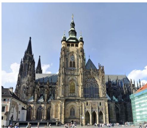
Slika 9. Katedrala Sv. Vida

Među nezaobilazne znamenitosti Praga spada “Katedrala sv.Vida”.