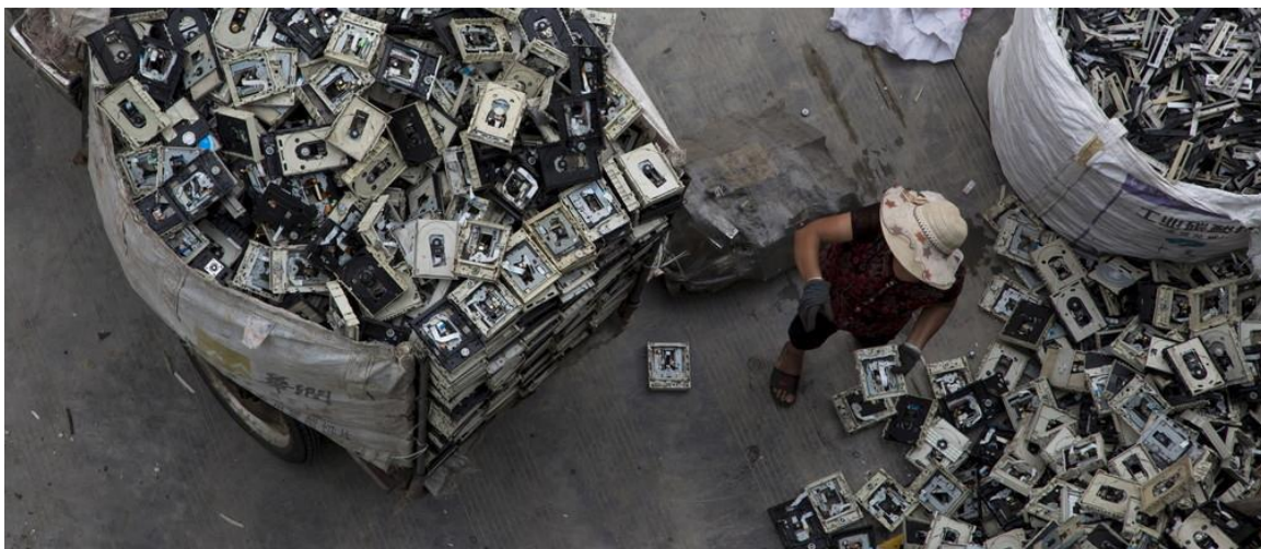
Slika 7. Problem EE otpada.