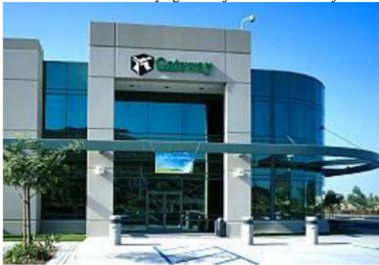
Slika 11. Gateway zgrada - sjedište u Kaliforniji