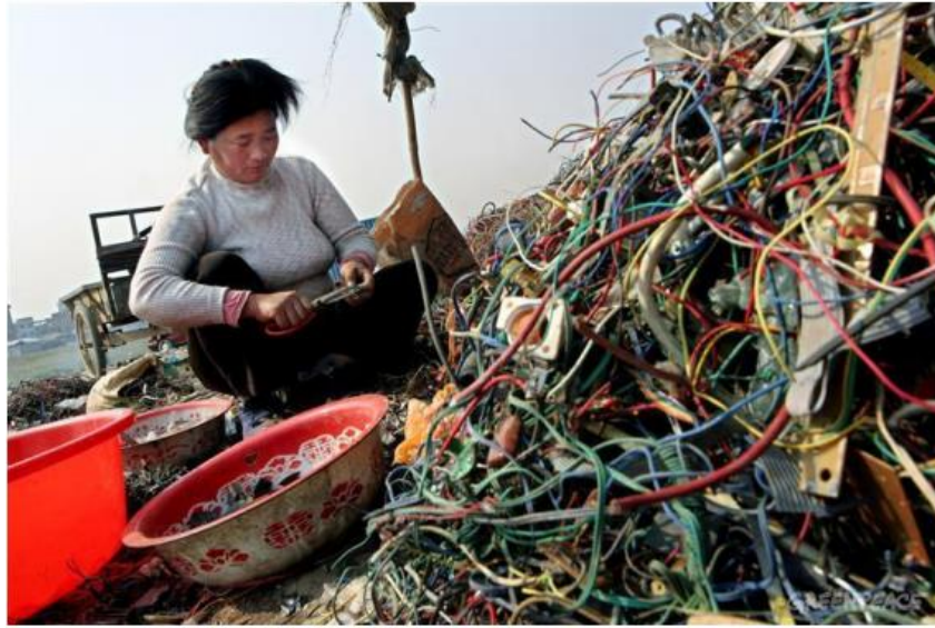
Slika 13. Primjer rastavljanja EE otpada na odlagalištu u gradu Guandongu, Kina