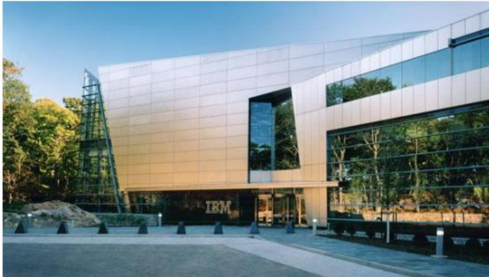
Slika 10. IBM-ova zgrada u New Yorku

Pod obrađenim predmetima vađenih iz EE otpada se broje mikročipovi, odbačene kamere, računala i druga elektronska pomagala. Ta je tvornica 2009. godine sakupila oko 120 tona zlata, 200 tona srebra, 4 tone paladija, jednu tonu platine, 100 kilograma rodija i manje količine rutenija i iridija. IBM, Dell, HP i Gateway su veliki proizvođači računala te na svojim web stranicama nude recikliranje njihovih računala ili originalnih hardvera. U SAD-u znaju organizirati turneje sakupljanja računala pa se u velikim gradovima prikupi i oporabi oko desetak tisuća računala, a EPA nudi besplatnu reciklažu, uz male troškove prijevoza.