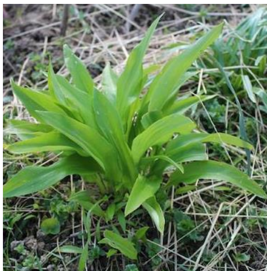
Slika 4.2. Medvjedi luk