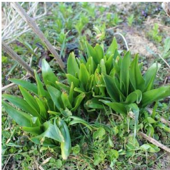
Slika 4.1. Mrazovac