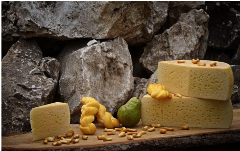
Slika 15. Paški sir

Stanovništvo otoka Paga tijekom stoljeća pripremalo je jela koja su mogla trajati dulje vrijeme, a jelovnik otočana uvjetovao je njihov način života koji je bio vezan uz pašnjake, polja i more. Najčešće se jelo usoljeno meso, usoljena riba, sir, skuta (Slika 15).