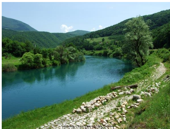
Slika 9. Rijeka Una

Općina Donji Lapac se nalazi na istočnom dijelu Ličko-senjske županije, u kraju poznatom po imenu Ličko Pounje, ispod planine Plješevice. Zauzima površinu od 354,2 km 2 te obuhvaća osamnaest naselja. Na križanju je magistralne prometnice Knin-Bihać i regionalnih prometnica D. Lapac-Udbina i D. Lapac-Bjelopolje. Općina Donji Lapac se nalazi na nadmorskoj visini od oko 600 m. Sa zapada je okružuju istaknuta uzvišenja Plješevice: Trovrh (1.620 m), Ozeblin (1.657 m) koji je ujedno i najviši vrh Plješevice, a sa sjeverne i istočne strane graniči s Bosnom i Hercegovinom gdje granica uglavnom prati kanjon rijeke Une ( http://www.unaspringoflife.com/pdf/StrategijaHr.pdf ). Povijest Donjeg Lapca seže još u antička vremena, u željezno i rimsko doba, o čemu svjedoče pronađeni ostatci predmeta, no sam grad osnovan je krajem 18. stoljeća, 1791. godine. U 19. stoljeću Donji Lapac se razvijao kao krajiški centar, dobro prometno povezan s okolnim i udaljenijim mjestima, međutim brojni ratovi na ovome području uvelike su utjecali na razvoj, ekonomiju i demografsku sliku grada. Prostor je gotovo netaknut, izrazito bogat florom i faunom, čistim zrakom i jednom od najljepših rijeka osigurava polazne mogućnosti za razvoj izvornog turističkog proizvoda i turističke ponude koja se u današnjim uvjetima prepoznaje kao lovni, ribolovni, planinarski, cikloturizam, odnosno izletnički turizam. ( http://www.donjilapac.hr ).