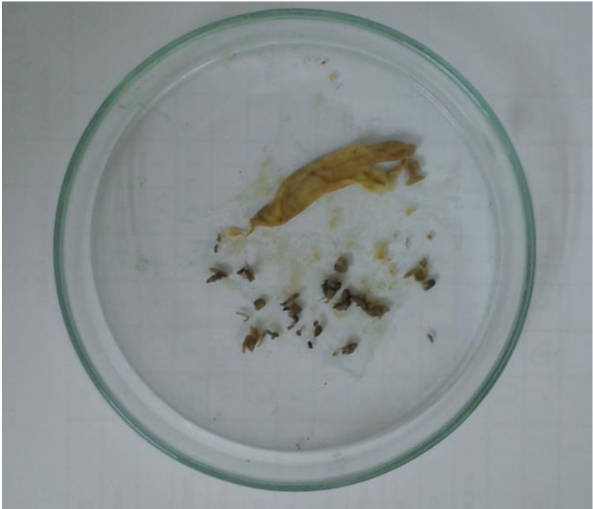
Slika 5. Izdvojene svojte nakon disekcije probavila (Autor: Ante Šango)

obzirom da su ga sačinjavale različite razgrađene biljke koje tvore biljnu masu, koja se nije mogla sistematski kategorizirati (Slika 7).