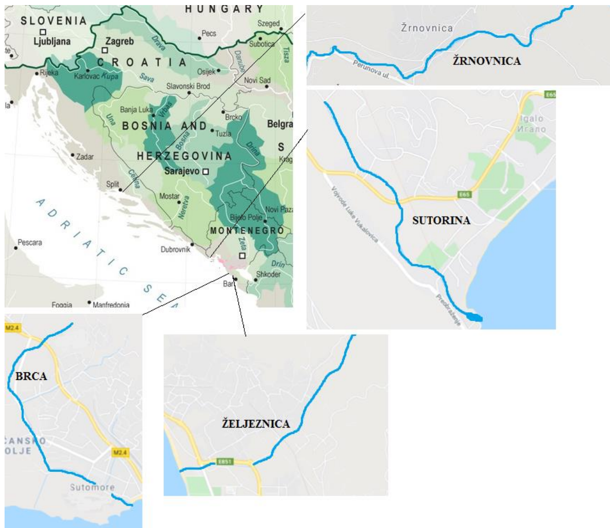
Slika 3. Lokacije uzorkovanja jegulje (Rijeke hrvatske, 2020; Google Maps, 2020a; 2020b; 2020c; 2020d)

Istraživanje je provedeno tijekom dana u proljeće, u tokovima triju krških rijeka Crne Gore, u rijeci Sutorini, Brci i Željeznici te u gornjem toku rijeke Žrnovnice u Hrvatskoj (Slika 3).