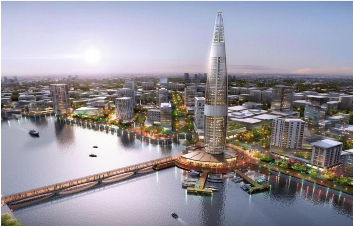
Slika 3. Mogući izgled zagrebačkog Manhattana