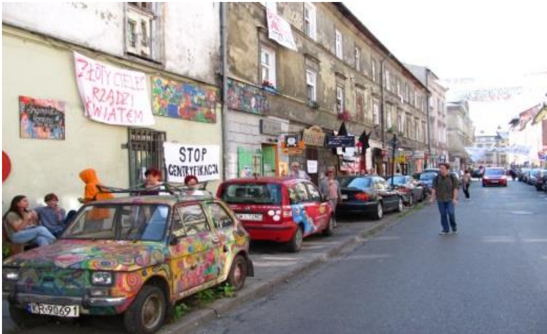
Slika 6. Lokalno stanovništvo na prosvjedu

Lokalno stanovništvo organizira brojne prosvjede protiv deložacija i procesa gentrifikacije koji je zahvatio tu povijesnu četvrt Krakova.