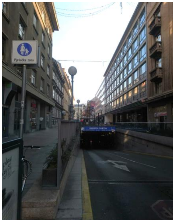
Slika 2. Garaža u Varšavskoj ulici u Zagrebu (siječanj 2020.)