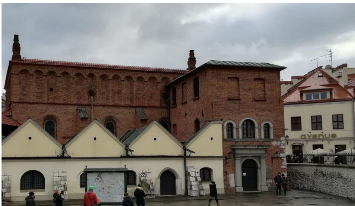
Slika 5. Kazimierz, pogled na Staru Sinagogu, a u pozadini na trendy restoran i klub Avenue (prosinac 2018., autorski rad)

Izvor: https://dziennikpolski24.pl/kazimierz-i-podgorze-przeklenstwo-gentryfikacji/ar/2969502