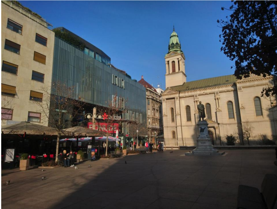
Slika 1. Izgled sadašnjeg Cvjetnog trga u Zagrebu (siječanj 2020.)