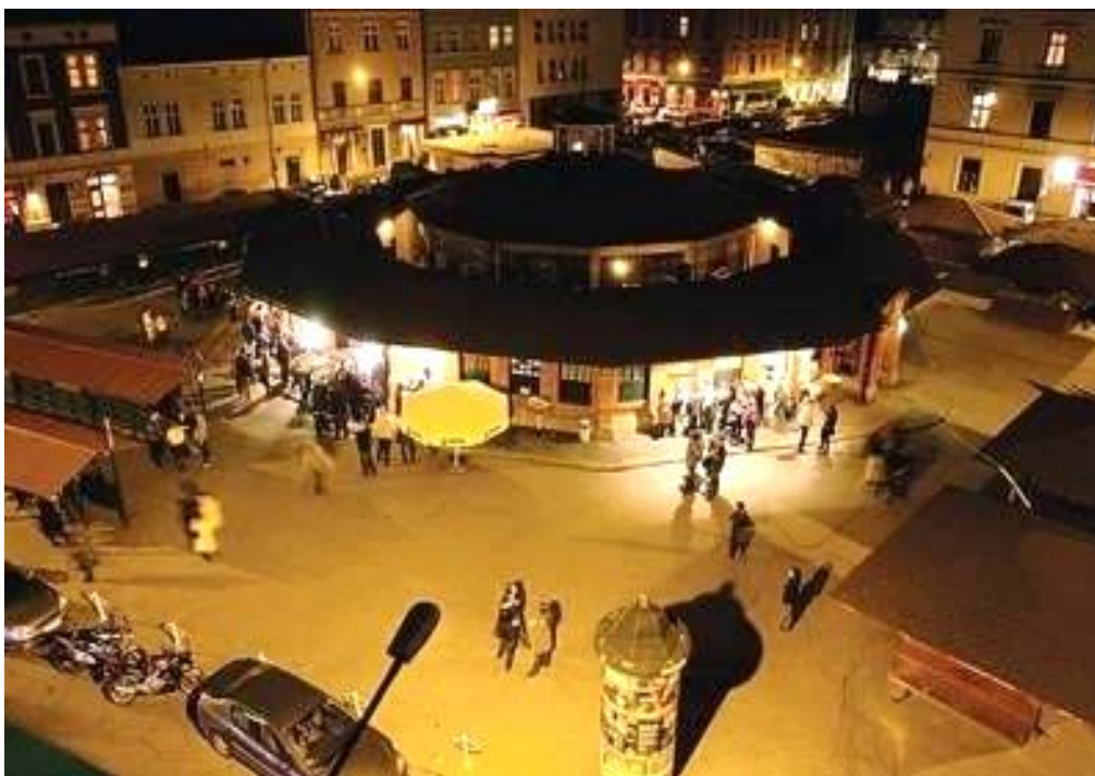
Slika 4. Novi trg je središnja točka gentrificiranog Kazimierza