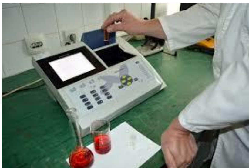
Slika 3.4.1. Spektrofotometar

Udjel ukupnih klorofila određuje se ekstrakcijom 1000 g pigmenta sa 25 mL 80%-tnog acetona. Spektrofotometrijski se pri 663 i 645 nm mjeri intezitet nastalog obojenja, a kvantifikacija se vrši prema jednadžbama od Huang i sur. (2007). Od homogenizirane tvari odvaže se 0,1 g te doda 25 mL 80%-tnog acetona. Otopina se vorteksira 2 minute, a dobiveni ekstrakt se filtrira kroz Whatman broj 4 filter papir i nadopuni s otapalom do oznake. Priprema ekstrakata i sva mjerenja provode se tri puta, a rezultati su izraženi kao srednja vrijednost \mu\text{g}\cdot\text{g}^{-1} suhe tvari (Haramija, 2019).