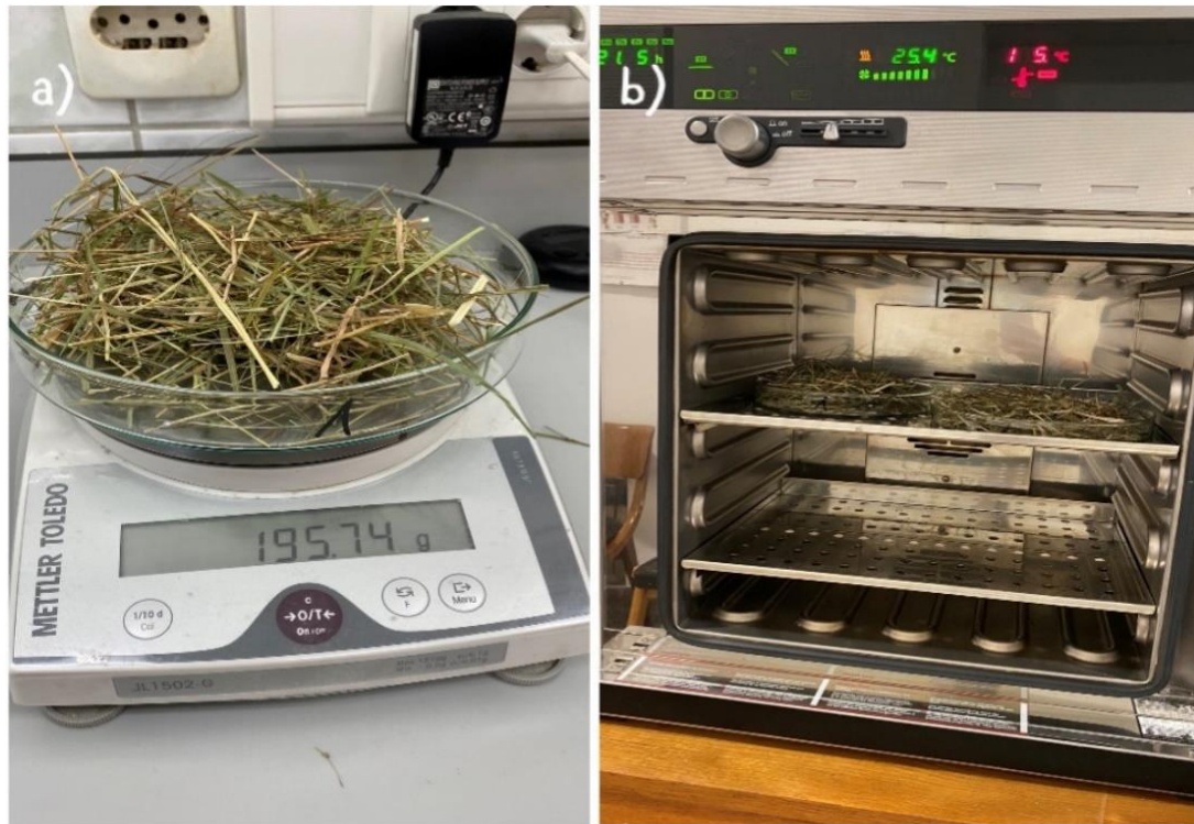
Slika 3.1.2. Vaganje (a) i sušenje (b) sijena za određivanje suhe tvari (vlastiti izvor)

Dostavna vlaga zelene mase i sijena određena je metodom HRN ISO 6496:2001 (DZNM 2001.) tako da se izvagalo oko 20 g sijena i zelene mase u paraleli (Slika 3.1.2.,a) te je stavljeno u sušionik na 103 °C kroz 24 sata (Slika 3.1.2.,b). Iz odnosa mase uzorka prije i poslije sušenja izračunat je udio dostavne vlage u uzorku (%). Dostavna suha tvar (ST) izračunata je kao razlika između 100 % i vrijednosti udjela dostavne vlage u uzorku zelene mase i sijena.