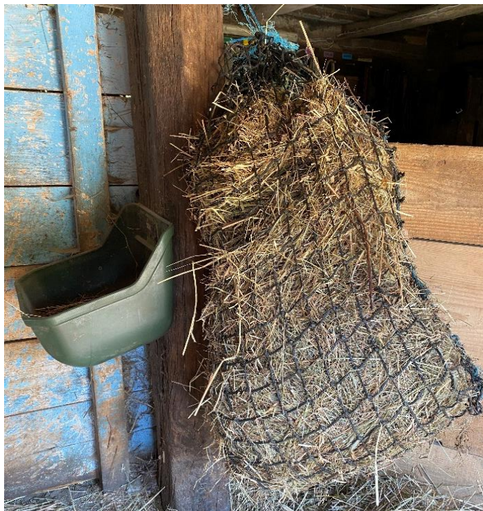
Slika 4.3.2. Prikaz individualne hranidbe sijenom