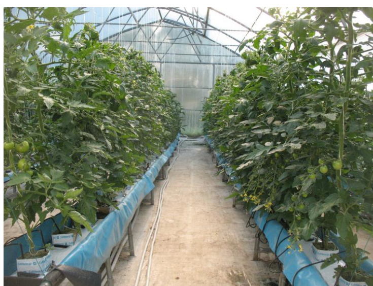
Slika 4. Uzgoj rajčice na supstratu u zaštićenom prostoru