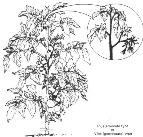
Indeterminate type or Vine (greenhouse) type