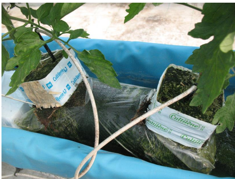
Slika 3. Kocke kamene vune s rajčicom na organskom supstratu (foto: R. Šetušić)

Proizvođač organskog supstrata Herbafertil te miješanog supstrata je domaća tvrtka Herbafarm Magnolija d.o.o. ( http://www.herbafarm-magnolija.hr/ ). Prosječan sastav organskog i miješanog supstrata prema analizi Zavoda za ishranu bilja Agronomskog fakulteta je prikazan u tablici 4. Razlika je u tome što se u miješanom supstratu nalazi i sporo otpuštajuće mineralno gnojivo Osmocote exact 16:9:12+2MgO+ME trajanja 3-4 mjeseca. Biljke su posađene na razmak 120 cm između redova i 33 cm unutar reda, čime je ostvaren sklop od 2,5 biljke po m 2 .