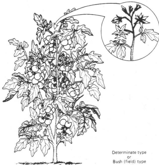
Determinate type or Bush (field) type

nije sasvim otvoren pa tako pelud dospijeva na tučak, čime se osigurava samooplodnja. U nepovoljnim uvjetima, naročito pri visokim temperaturama, tučak se izduži iznad prašnika i tako omogućuje stranooplodnju uz pomoć insekta. Plodnica iz koje se razvija plod mesnata boba može biti dvogradna, trogradna ili višegradna (Lešić i sur., 2004).