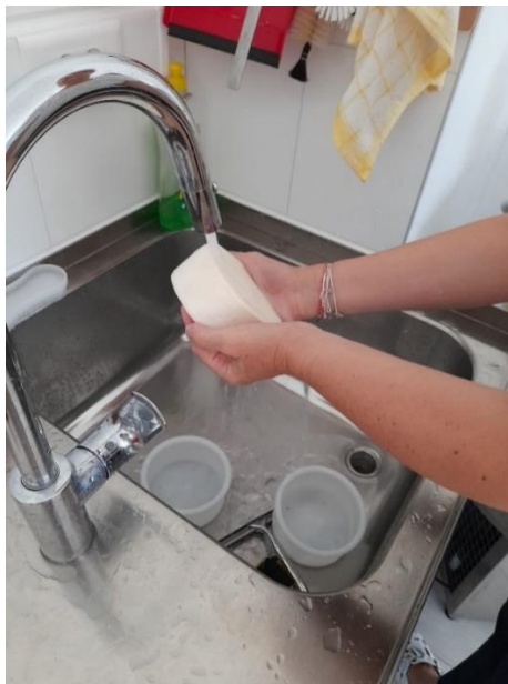
Slika 3.1.11. Pranje sireva po završetku soljenja