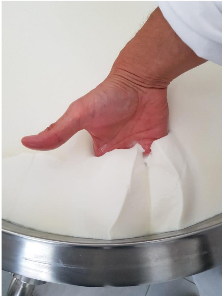
Slika 3.1.3. Provjera čvrstoće gruša i boje sirutke

Sirenje mlijeka završilo je kada je postignuta određena čvrstoća gruša, što je provjereno uranjanjem ruke u grušu i podizanjem gruša, pri čemu on puca, a na mjestu pukotine stjenke gruša su glatke, dok je sirutka bistre zelene-žute boje (Slika 3.1.3.). Sirenje je trajalo 50 - 60 minuta nakon čega je gruša rezan sirarskom harfom (Slika 3.1.4.) do zrna oštih rubova veličine lješnjaka/oraha (Slika 3.1.5.).