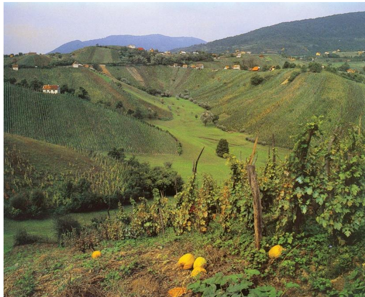
Slika 2.1: Prigorje Plešivice, gorja jugozapadno od Zagreba, dio je brežuljkastoga peripanonskog ruba.

Kontinentalna Hrvatska je pretežno nizinska, a iz nizine se izdižu šumovita gorja s visinama nižim od 1000 m (Psunj, Papuk, Krndija). Rubni dio Panonske nizine prelazi u brežuljkasti peripanonski prostor sa znatnijim udjelom gorja koja negdje prelaze 1000 m nadmorske visine (Medvednica, Ivančica, Žumberačka gora) (Slika 2.1.). To je brežuljkasti kraj u kojem se ističu tri glavne sastavnice: gore, pobrđa i riječne doline. Gore se ističu visinom, izgledom i sastavom te su većinom prekrivene šumom.