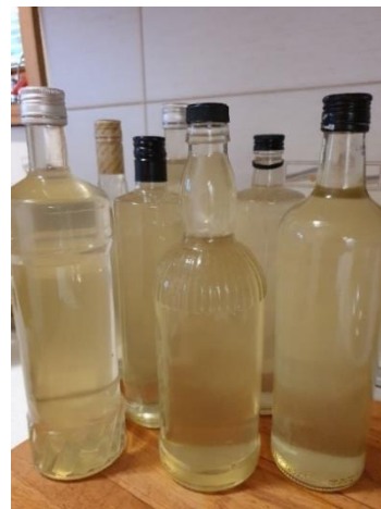
Slika 4.3. Priprema sirupa od bazge

Vrlo česta upotreba samoniklog bilja je bila za pripremu alkoholnih pića. Prema istraživanju Blagec (2020) najviše su se u SZ Hrvatskoj koristile vrste: pelin ( Artemisia absinthium L.), orah ( Juglans regia L.), divlja kruška ( Pyrus pyraster (L.) Burgsd.), loza ( Vitis vinifera L.), drijen ( Cornus mas L.) i malina ( Rubus idaeus L.). Bilje se koristilo za pripremu rakija, likera ili vina. Recept za liker od oraħa u Prilozima (Slika 4.4.). Pića su se radila u obliku svježeg soka, sirupa, čaja ili alkoholnog pića. Ljudi su ih koristili kao okrepju u napornom fizičkom poslu