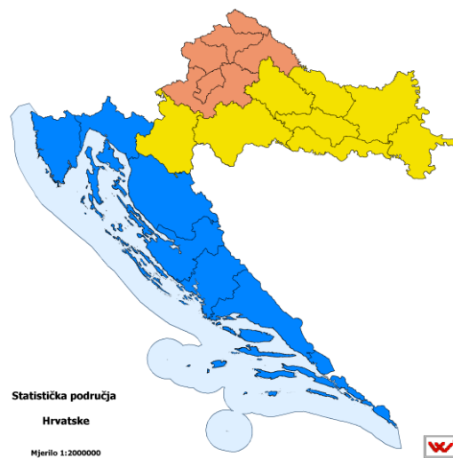
Slika 2.2. Prikaz statističkih područja Hrvatske

Međimurska županija. Ukupno sjeverozapadna Hrvatska obuhvaća 29 gradova i 116 općina ( https://hr.wikipedia.org/wiki/Sjeverozapadna_Hrvatska ).