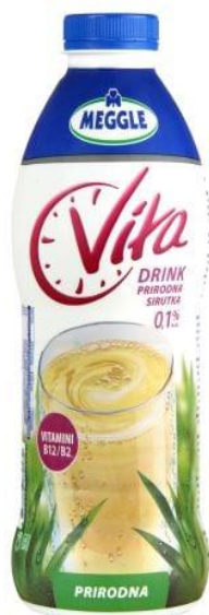
Slika 2.2.5. Meggle Vita sirutka