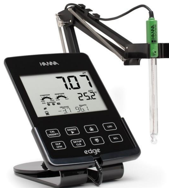
Slika 8. pH-metar

pH vrijednost mošta i vina se kreće između 2.8 – 4.0. pH vrijednost utječe na niz biokemijskih i fizikalno-kemijskih procesa tijekom dozrijevanja i starenja vina. Vina koja imaju nižu pH vrijednost su pogodnija za čuvanje budući da se u njima teže razmnožavaju nepoželjni mikroorganizmi. pH vrijednost mošta i vina određuje se uređajem koji se naziva pH-metar.