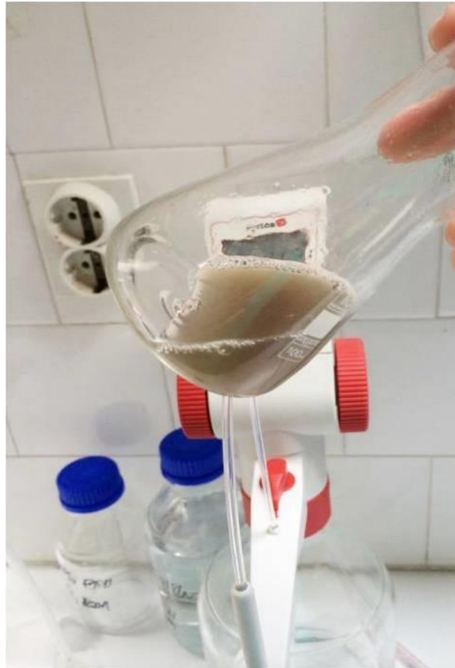
Slika 7. Direktna titracija

Postupak je takav da se 10 ml uzorka otpipetira u laboratorijsku čašu te se dodaju 2 – 3 kapi indikatora bromtimol plavog. Titracija se provodi sa 0.1 M NaOH do pojave maslinasto zelene boje.