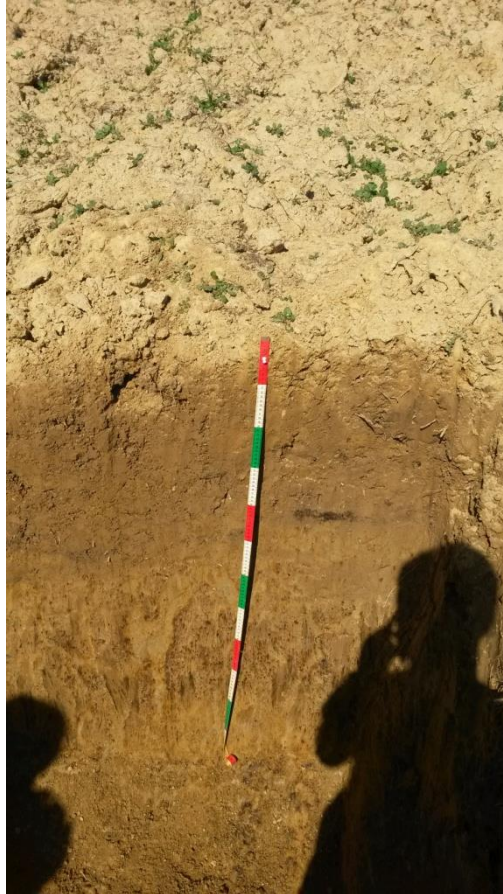
Slika 3. Pedološki profil tla u Jazbini

nepovoljnih fizikalnih i kemijskih svojstava. U manjoj mjeri prisutna je ilovača, dok pijeska i skeleta gotovo da nema. Reakcija tla je vrlo kisela što dokazuje niska pH vrijednost koja se kreće od 3.8 do 4.1 (Škorić, 1957). Tlo je siromašno humusom, opskrbljenost dušikom je umjerena, dok su kalij i fosfor u deficitu.