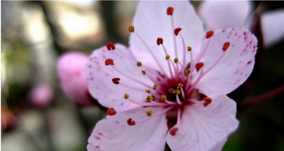
Slika 2.2.7.1. Cvijet trešnje

Glavni oprašivači trešanja su pčele. Cvatnja traje tri do četiri dana, a započne kad srednje dnevne temperature dosegnu od 8 do 15 °C.