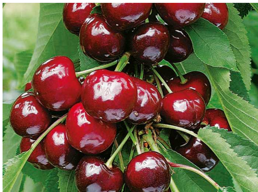
Slika 2.6.2 .1. Plod sorte 'Kordia'