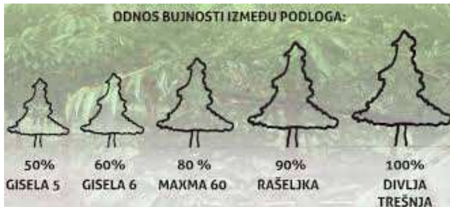
Slika 2.5.1 Prikaz odnosa bujnosti između podloga

podloge, odnosno sjemenjak divlje trešnje ( Prunus avium ) i sjemenjak rašeljke ( Prunus mahaleb ); a od vegetativnih Gisela, F 12/1 i Colt.