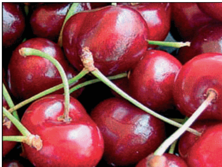
Slika 2.6.1.1 Plod sorte 'Summit'

Summit je stranooplodna sorta, dobivena 1957. godine u Summerlandu u Kanadi. U istraživanju koje je proveo Blazkov (1996) sorte 'Summita' koje su bile oprašene vjetrom ili insektima imale su 17,5 % više plodova od onih koje su oprašene od drugih sorata trešnje. Miljković (2011) navodi da je za 'Summit' dobar oprašivač sorta 'Lapins'. Pogodna je za srednje bujne podloge. Plod (Slika 2.6.1.1.) je srednje velik, srcolikog oblika sa prosječnom masom oko 9,2 grama. U našim krajevima plodovi dozrijevaju između 10. i 12. lipnja (Miljković, 2011).