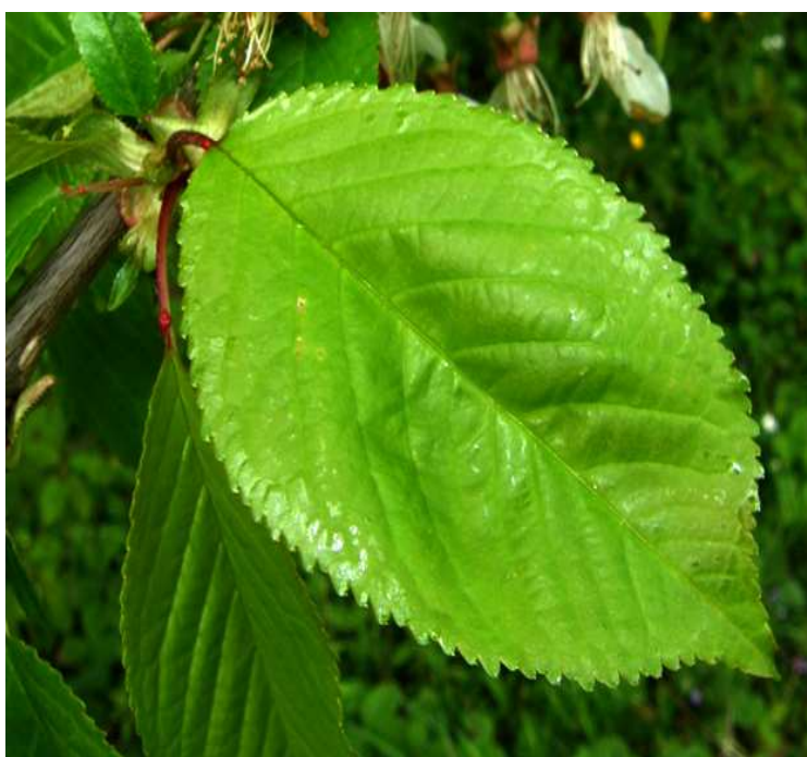
Slika 2.2.6.1. List trešnje

Dužina peteljke je sortno svojstvo i doprinosi pravilnoj determinaciji sorti trešnje (Mitrović, 1982). Prema nekim autorima, duža peteljka se navodi kao prednost, zbog olakšane berbe i manjeg truljenja plodova (Brown i sur., 1996), dok prema drugima kraća peteljka intenzivno zelene boje asocira kupce na svježinu i sočnost ploda (Schick i Toivonen, 2000). Albertini i Della Strada (2001) navode da se sorte 'Kordia', 'Karina' i 'Regina' odlikuju dugom peteljkom, dok je peteljka sorte 'Summit' srednje duga. Milatović i sur. (2011) ističu da plodovi sorte 'Summit' imaju srednje dugu, a sorte 'Kordia' i 'Regina' dugu peteljku. Masa peteljke sorti trešnje je relativno mala do 0,1 g ( Stančević i sur., 1988).