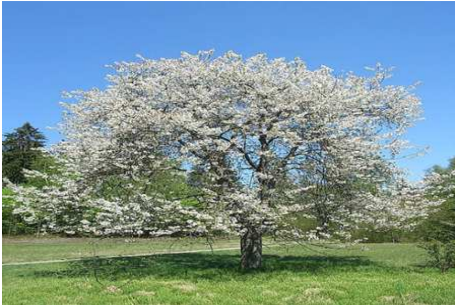
Slika 2.2.4.1. Krošnja trešnje

debla. Trešnja ima skeletne i obrastajuće grane neovisno o uzgojnom obliku. Plošni uzgojni oblici imaju samo primarne grane, rijetko sekundarne grane, dok prostorni uzgojni oblici imaju primarne skeletne grane na koje se nastavljaju sekundarne skeletne grane, a na sekundarne se dalje nastavljaju tercijarne itd. Grane sa rodnim i nerodnim izbojcima nastaju na skeletnim granama.