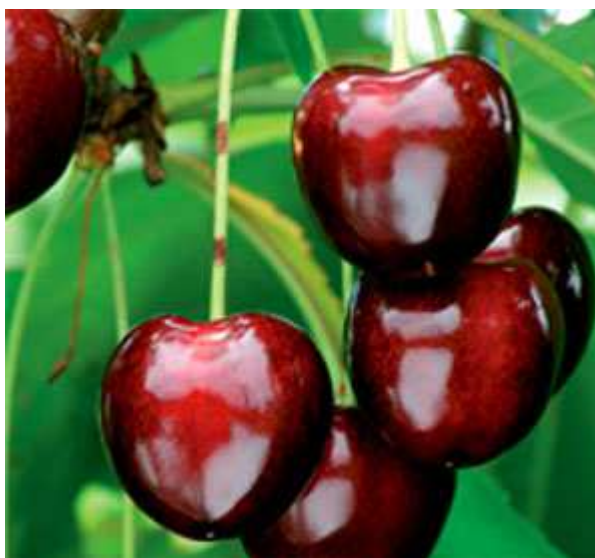
Slika 2.6.3.1 Plod sorte 'Techlovan'