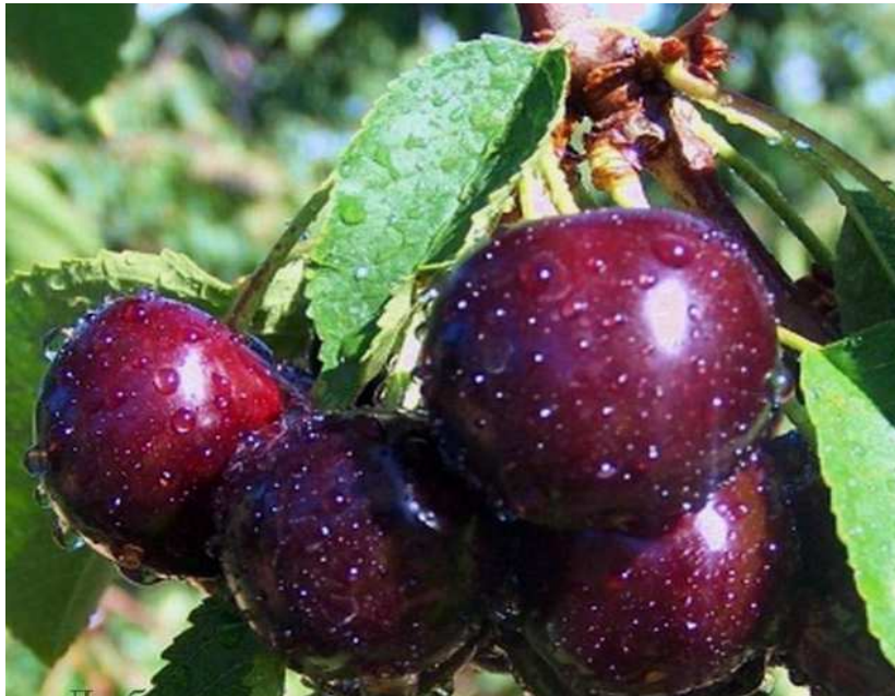
Slika 2.6.4.1 Plod sorte 'Ohridska Crnica'

Sorta Ohridska crna (Slika 2.6.4.1.) raste oko Ohridskog jezera koje se nalazi na granici Makedonije i Albanije. Ovo je sorta srednje bujnog rasta, a krošnja je dobro razgranata. Daje plodove tamno crvene do crne boje, srednje do velike krupnoće. Sorta Ohridska crna je trešnja kasnog cvata, a sazrijeva u srpnju mjesecu.