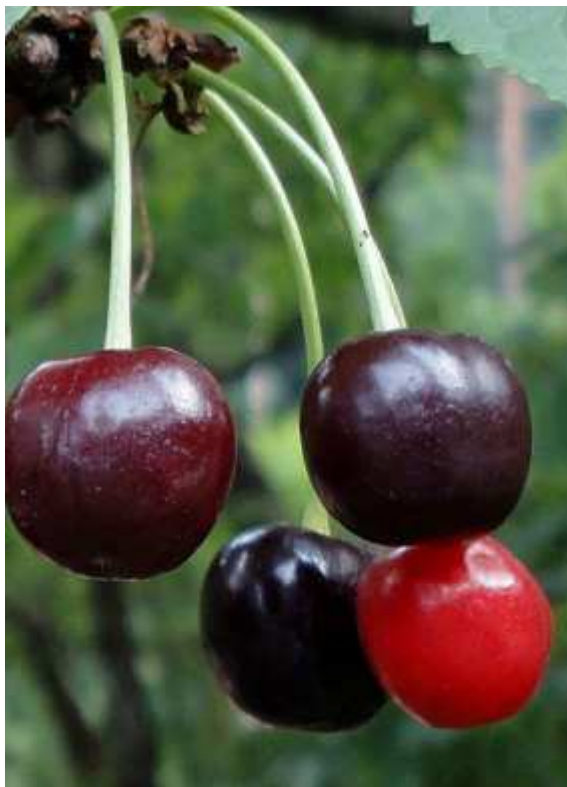
Slika 2.2.7.1. Plod trešnje